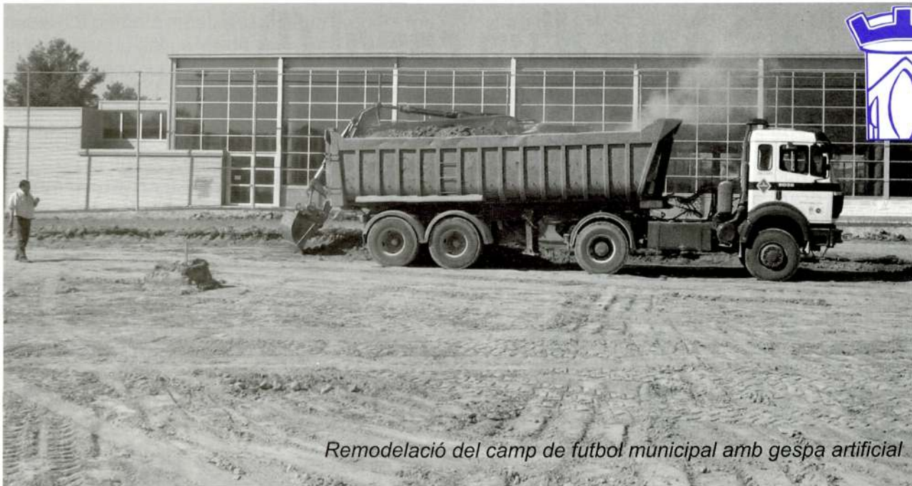
Remodelació del camp de futbol municipal amb gespa artificial

El Ple, en sessió del 21 de maig de 2007, va aprovar definitivament els expedients de contribucions especials per les obres Pavimentació del camí Vell i accessos a Alpicat, Millora de la urbanització Buenos Aires i Pavimentació i millora de les instal·lacions de l'àmbit Pla de la Cerdera.