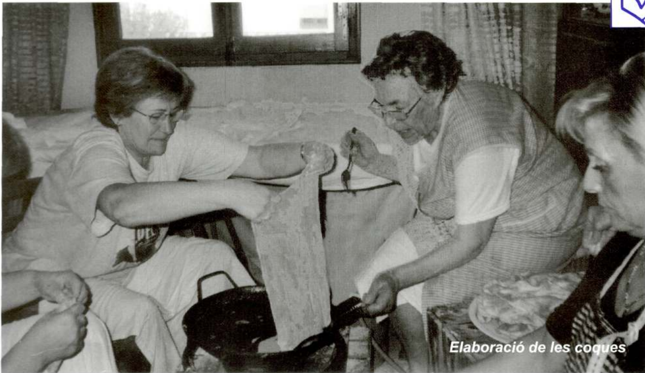
Elaboració de les coques

Des dels Dolors es pot parlar de tantes coses! Avui no vull fer-ho de penes i necessitats, que tots sabem ben bé què són. Avui, des de la Congregació dels Dolors, us volem donar les gràcies a tantíssima gent meravellosa que el dia de la fira Ecojardí 2005 d'Alpicat van visitar el nostre estand.