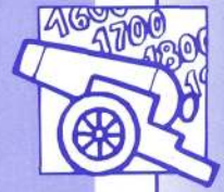
Segell de la Cooperativa. Any 1947

Bilbao). Alguns pagaments s'havien d'avançar i altres s'havien de fer al comptat, com el sulfat amònic, que al juny de 1943 va comprar la cooperativa, i amb motiu del qual va fer tres pregons perquè alguns socis el paguessin, ja que, en cas contrari, es perdria aquest adob. Tot un seguit de dificultats que dona a entendre l'apatia amb què s'actuava, fins al punt que no es convocaven les assemblees generals obligatòries i el delegat sindical de Lleida va haver de recordar a la Junta les seues obligacions. La Junta Directiva va mostrar el seu interès per cessar (ja que no podien dimitir), però durant un any van intentar convocar una assemblea general i no es pogué constituir per falta de quòrum. Finalment, va intervenir el jefe provincial per fer el cessament i l'elecció de la nova Junta.