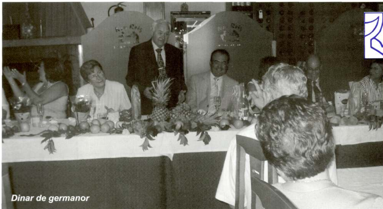
Dinar de germanor

Aprofitem l'ocasió per agrair públicament la col·laboració de tots els conferenciants que, d'una forma desinteressada, ens van fer gaudir dels seus coneixements i de l'entitat Res Non Verba de Lleida, que ens va prestar les obres per exposar-les al Casal. GRÀCIES A TOTS.