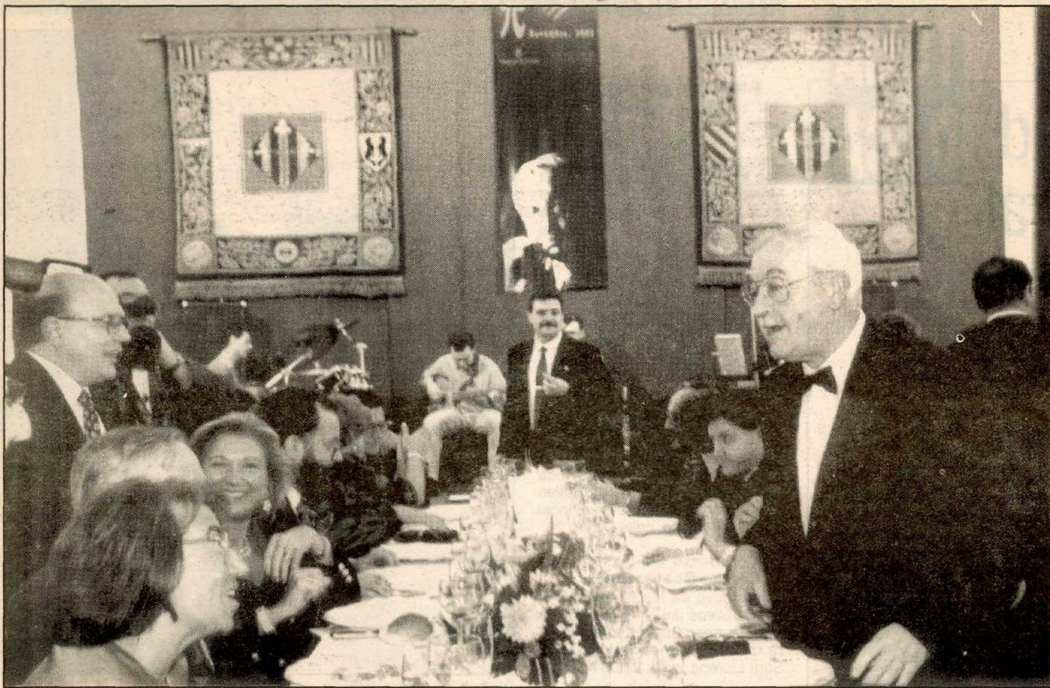
El premio que rinde homenaje a Vallverdú se presume ya completamente consolidado.