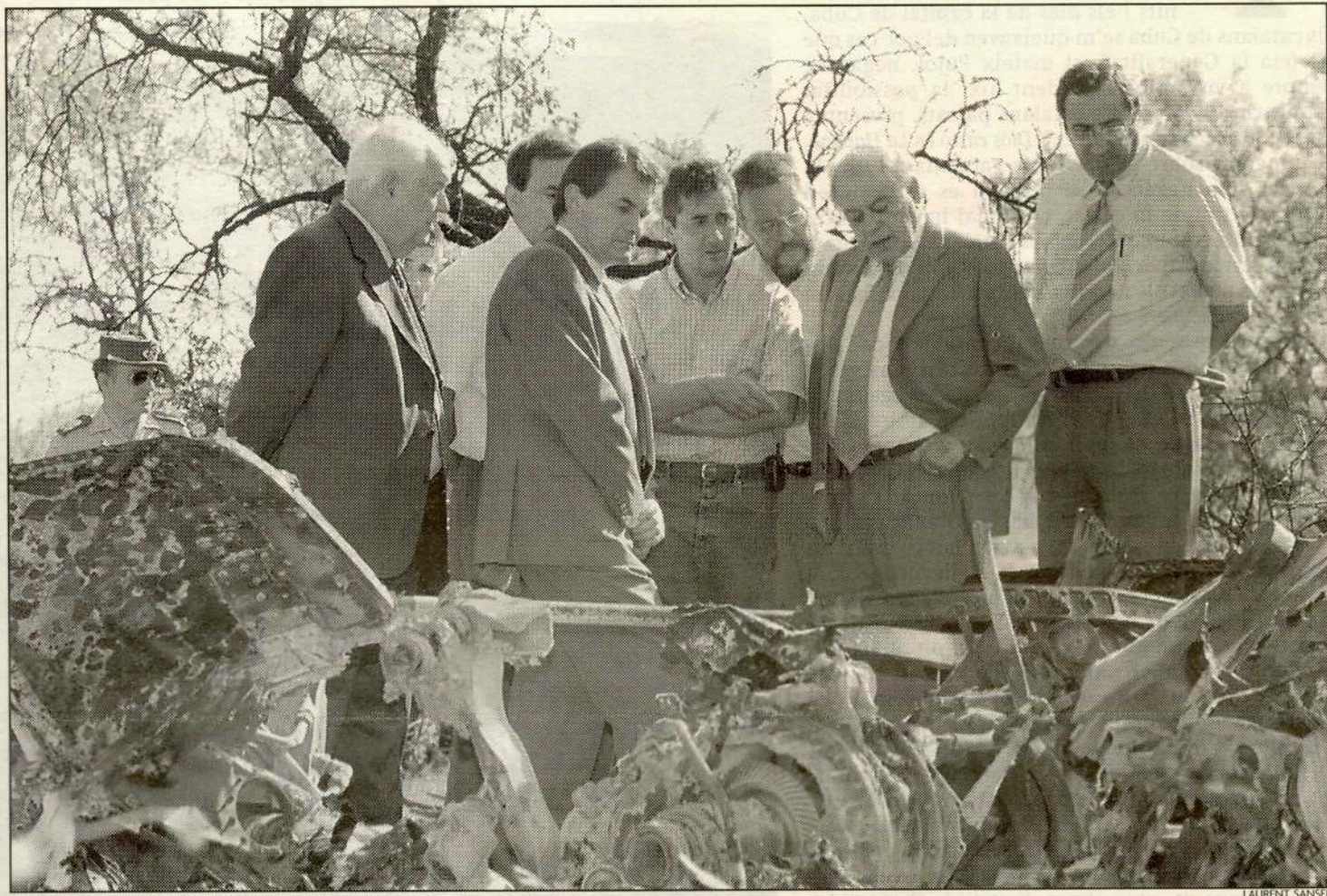
El president Pujol, el conseller en cap, Artur Mas, i el titular d'Indústria, Antoni Subirà, contemplen les restes de l'aparell sinistrat

L'aparell es va estavellar de retorn a Lleida -on havien de baixar la delegada i els dos