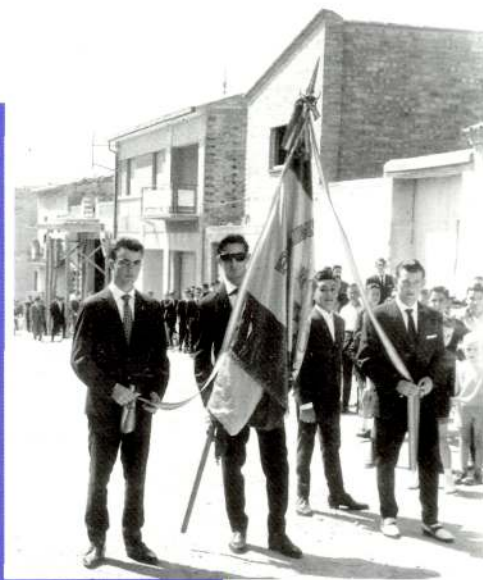
Capçalera d'una processó de la Festa Major

Una altra cosa que em ve a la memòria són les nostres famoses festes majors, d'aquells temps, amb les processons amenitzades per les orquestres, les misses cantades, els concerts, els balls a l'envelat, els balls de vermut, els balls del fanalet, el sorteig de la toia, les curses a peu i en bicicleta pels carrers del nostre poble, les atraccions, els tendals dels cafès de l'Arturo, del Llorenç i el del Sindicat perquè la gent pogués resguardar-se del sol a l'hora de prendre un refresc, o de fer el vermut abans d'anar a dinar, les parades dels torronaires, etc.