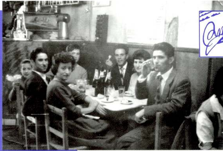
Sessió de vermut d'una Festa Major