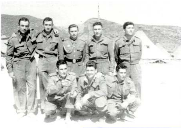
Campament de Tarn. Grup de quintos d'Alpicat Lleves del 1957, 58 i 59

Al cap d'un llarg temps, algunes vegades durava dos o tres anys, es retornava a casa i es començava a plantejar-se el moment de formar una família. La majoria de nosaltres vàrem tenir la sort de poder-nos aparellar amb noies i nois del nostre poble o de les rodalies, perquè en aquells temps no hi havia la facilitat de desplaçar-se com tenen avui en dia els nostres fills a localitats més llunyanes. Després ens arribaren els primers fills i com sabeu vàrem haver de criar-los, com van fer els nostres pares amb nosaltres, això sí, amb moltes menys dificultats, perquè gràcies a Déu els nostres fills han tingut la sort de no haver de viure les penúries, com he dit abans, de la nostra infantesa i joventut. Els anys han anat passant i avui ens trobem aquí, jubilats, on hem recordat els trets principals de la nostra vida viscuts a Alpicat, el nostre entranyable poble. Segurament podríem haver dit moltes coses més, però no vull allargar-me més per no cansar-vos. Ja us he donat prou la llauna, però no vull acabar sense dir-vos que personalment estic molt satisfet d'estar acompanyat de tots vosaltres i que hauríem de mirar de no esperar tants anys per a tornar-nos a trobar, per a tornar a reviure tan agradables records. Una abraçada molt forta a tots, i per molts anys.