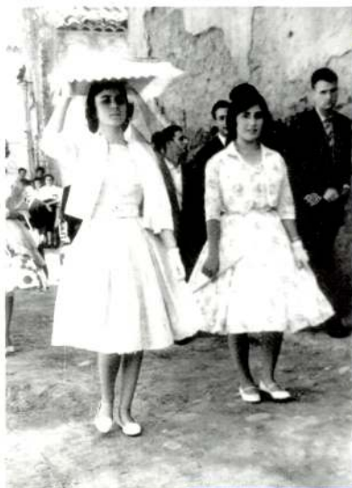
Processó de la Festa Major de 1958