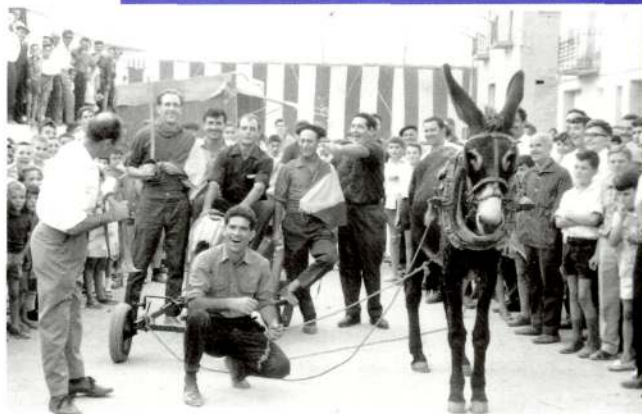
Jocs de la Festa Major de 1965. Al fons es veu l'envelat instal·lat a la plaça de Catalunya actual

Més endavant van arribar els nostres primers festejos. D'aquells temps recordem les festes dels diumenges. A la tarda s'acostumava a anar primer al cine i en sortir s'anava al ball de la sala la Unió, fins a l'hora de sopar. En aquella sala les mares s'asseien a les llotges o als bancs laterals de la sala des d'on controlaven les relacions dels seus fills o filles. De tant en tant se sentia dir: "has vist?, fulano o fulana sembla que comencen a rondejar".