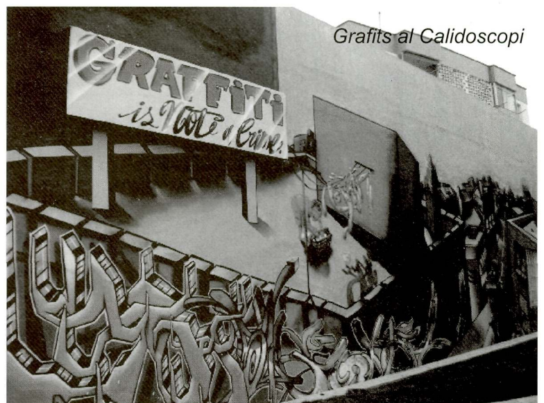
Grafits al Calidoscopi

És una mesura que permet canviar la consideració de vandalisme urbà, que normalment està castigat amb sancions econòmiques exemplars, amb serveis socials o amb altres mesures correctores perquè els autors d'aquests actes vandàlics s'ho pensin una mica abans de fer la seva malifeta, per una altra consideració que és el reconeixement d'una habilitat artística.