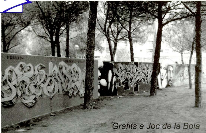
Grafits a Joc de la Bola

Doncs, la resposta és molt senzilla, ambdues afirmacions són una realitat, si bé, tot depèn de l'objectiu que tingui l'autor.