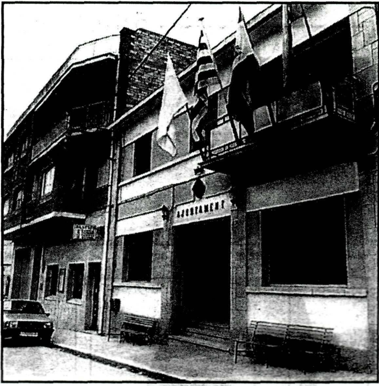
Alpicat ha convidat una orquestra cada nit.