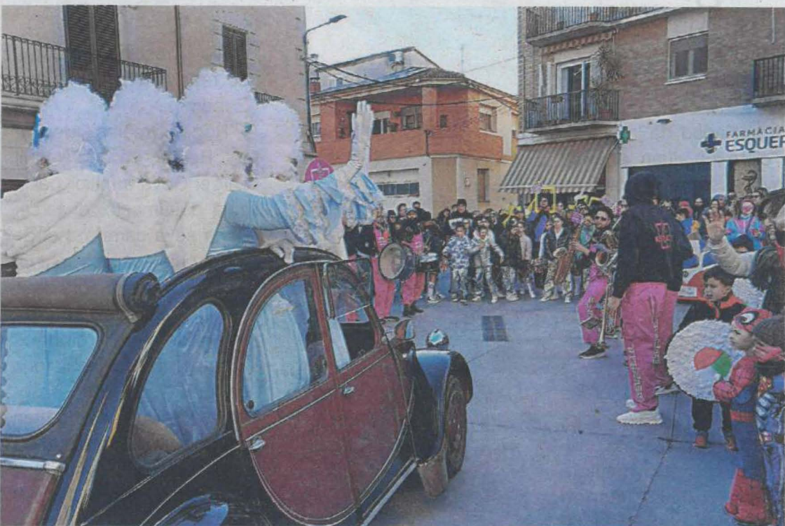
La desfilada de Palau d'Anglesola presidida per les Reines Carnestoltes