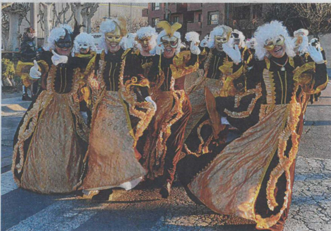
La desfilada de Mollerussa va reunir 1.600 participants i 18 comparses