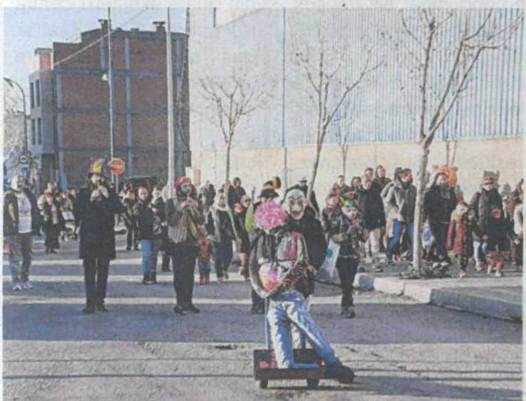
La gran rua d'Almacelles