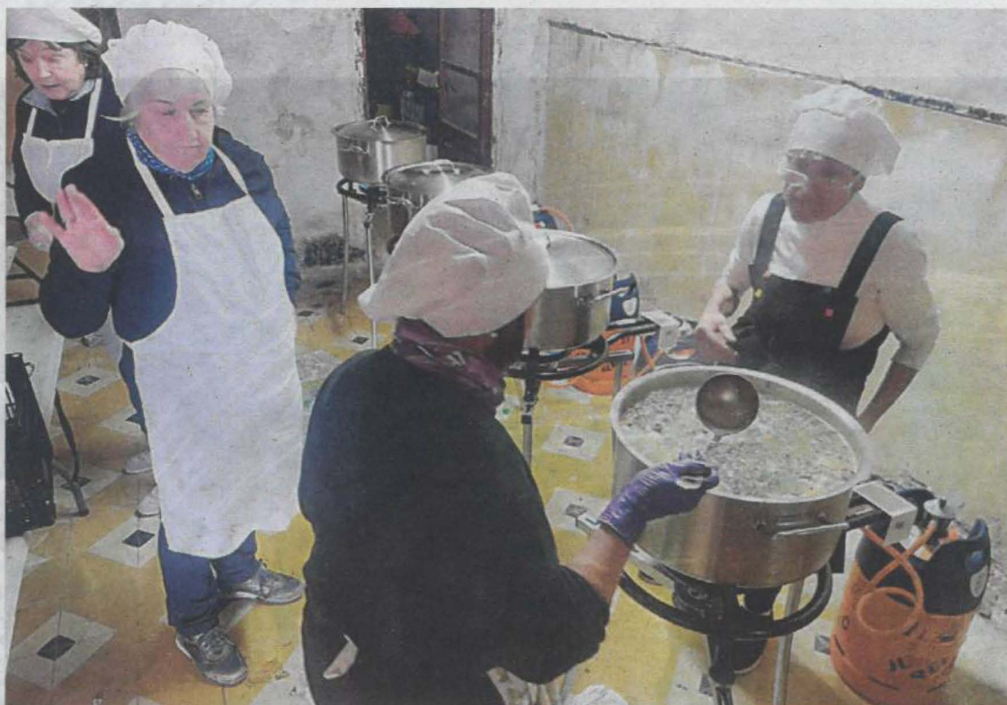
La tradicional olla de congre va ser la protagonista de la festa a Balaguer