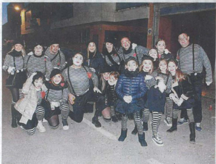
Concurs de comparses a Alpicat