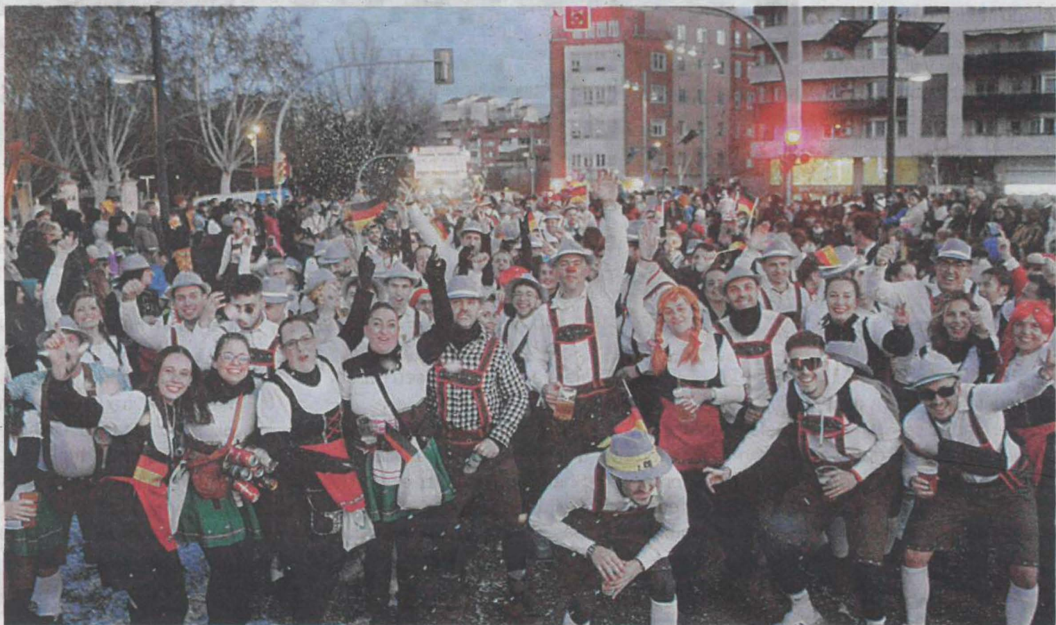
La gran rua popular del Carnaval de Lleida va reunir milers de persones i nou comparses

El Carnaval d'Agramunt va començar amb el concurs d'establiments i carrers abans de la concentració de comparses i la gran rua pels carrers de la vila.