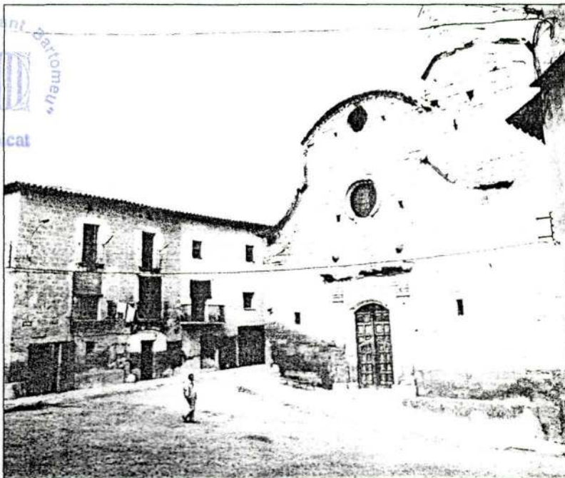
Alpicat és una població agrícola pròpera a Lleida.

Hi passa la carretera de Lleida a Montsó, al costat de la qual es troben les basses d'Alpicat, construïdes entre el 1901 i el 1932 per depurar l'aigua del canal de Pinyana, destinada al proveïment d'aigua.