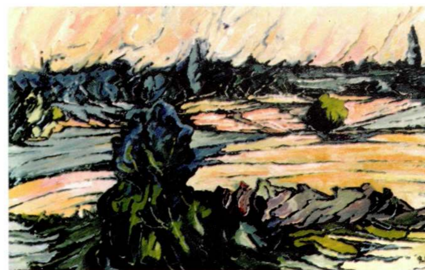
Pla d'Urgell Oli sobre llenç 1998