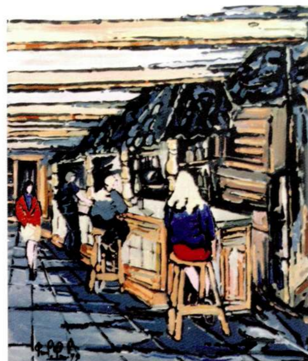
La Granja del Santi Oli sobre llenç 1999