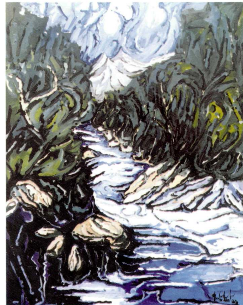
Pirineu Aragonés Oli sobre llenç 1998