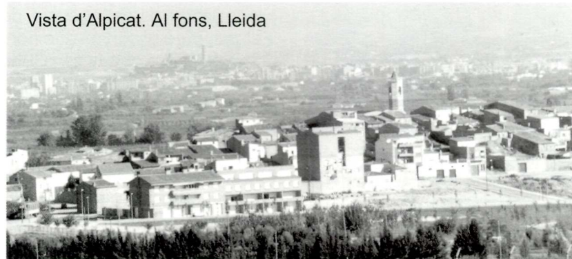
Vista d'Alpicat. Al fons, Lleida

Aquesta obscura primera dècada dels anys 40 es clogué amb un canvi prou important a la nomenclatura de la població. En 1947, Vilanova d'Alpicat passà a dir-se oficialment Alpicat, no sense polèmica per les veritables raons. El motiu oficial fou que la paraula Vilanova feia anys que no s'utilitzava; el motiu oficiós fou que passant a dir-se només Alpicat ens col·locàvem alfabèticament al capdavant de les llistes de racionament.