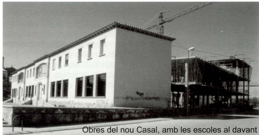
Obres del nou Casal, amb les escoles al davant

anys un important projecte d'urbanització de tots els carrers del poble. Per altra banda, des del sindicat agrícola s'impulsà dos importants projectes, la construcció d'un