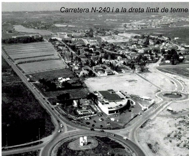
Carretera N-240 i a la dreta límit de terme

Fent un salt en el temps ens situem al segle XVIII, acabada la Guerra de Successió amb la derrota dels interessos de Catalunya, el nou rei Felip V implantà un seguit de lleis unificadores i centralistes conegudes amb el nom de decrets de Nova Planta. Un d'aquests decrets establia un impost recaptatori igual per a tots els territoris que s'anomenava cadastre. Per tal de gestionar-lo totes les poblacions havien de fer un qüestionari. Alpicat, obviant la seua pertinença a Lleida, respongué i començà a cobrar aquell nou impost. Lleida estava en hores baixes, ja que havia perdut els seus privilegis adquirits amb la Paeria. El conflicte va esclatar pocs anys després. Alpicat no tenia un terme municipal definit i tots dos municipis