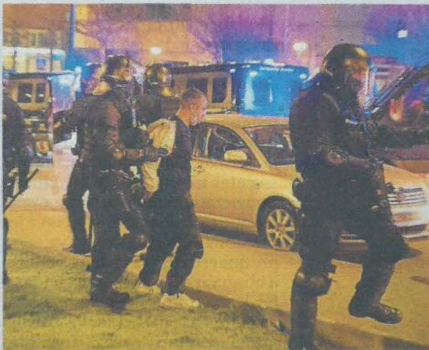
Un dels detinguts dimarts a Lleida.

El jutjat d'instrucció número 4 de Barcelona va decretar ahir presó provisional sense fiança per a un dels detinguts dimecres a la nit a la capital catalana durant els aldarulls posteriors a la manifestació en favor de Pablo Hasél. Els altres sis detinguts que van passar a disposició judicial van quedar en llibertat amb l'obligació de comparèixer cada dues setmanes al jutjat. Sobre ells pesen acusacions pels delictes de desordres públics, danys, atemptat a l'autoritat i lesions.