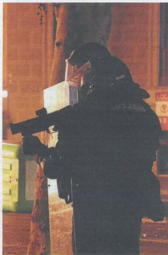
Un agent dels Mossos apuntant amb una llançadora de foam.

Castejón aposta per plantejar l'ús d'altres eines, com el canó d'aigua o el gas pebre: "El problema és que ningú ho vol assumir". Assegura que les pilotes de goma -que no poden fer servir els Mossos però sí altres cossos, com la Policia Nacional- tenen un efecte "més dissuasiu pel soroll", però no demana que retornin, sinó que els posin més recursos. De fet, els Mossos conserven les escopetes de les bales de goma per tirar salves. —