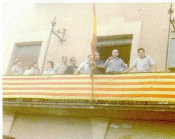
AJUNTAMENT DE SERÒS

Les formacions independents van ser les guanyadores en la majoria de les poblacions del Segrià a les eleccions municipals del 3 d'abril del 1979. Així va succeir a Almacelles, Alguaire, Seròs, Alpicat i Torrefarrera, on es van imposar davant de l'omnipresent