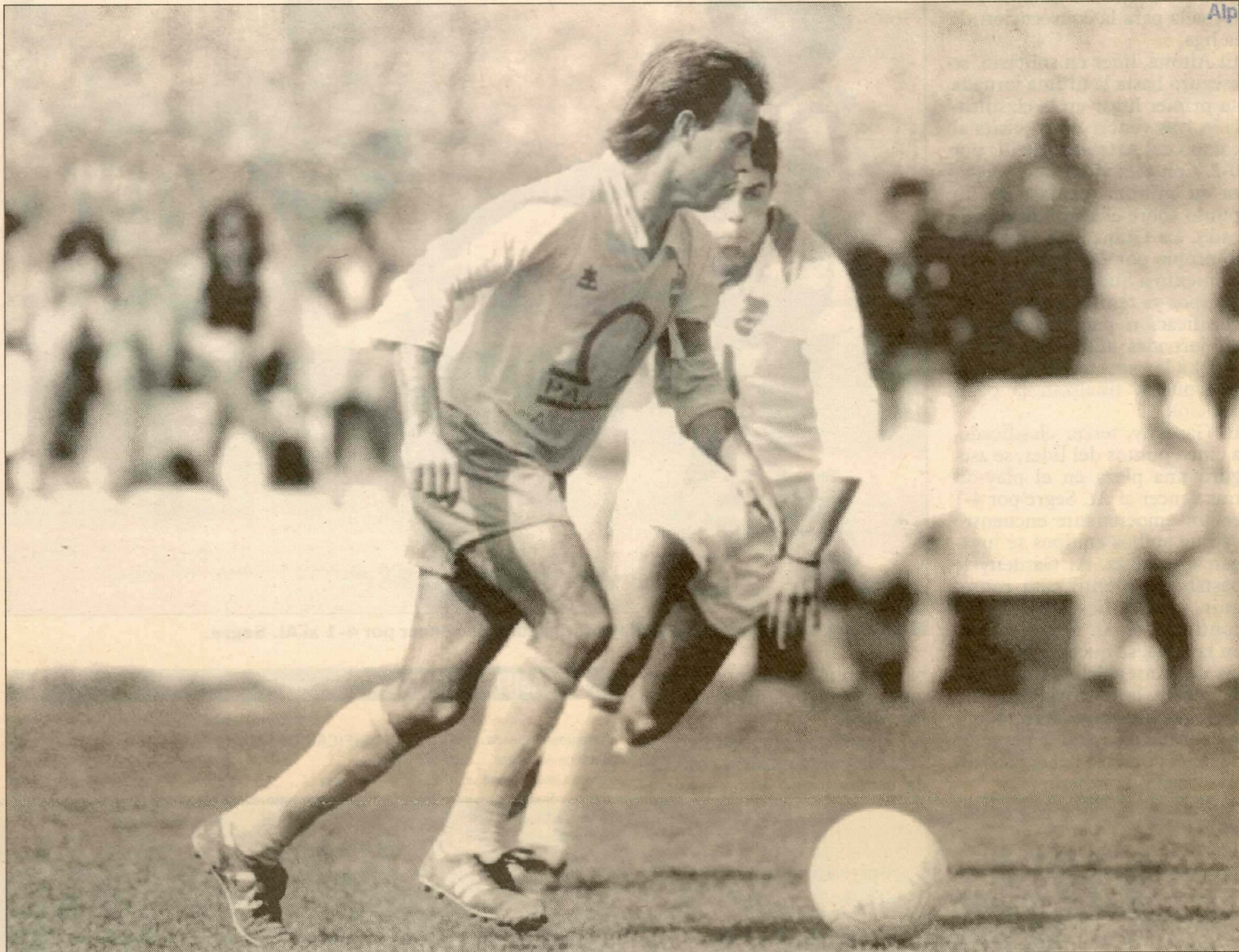
Un jugador del Alpicat se lleva en franquicia un balón ante el acoso de un visitante. Los locales impulsaron su defensa.

Tras el descanso, el partido se "rompió" definitivamente y salió de su monotonía habitual