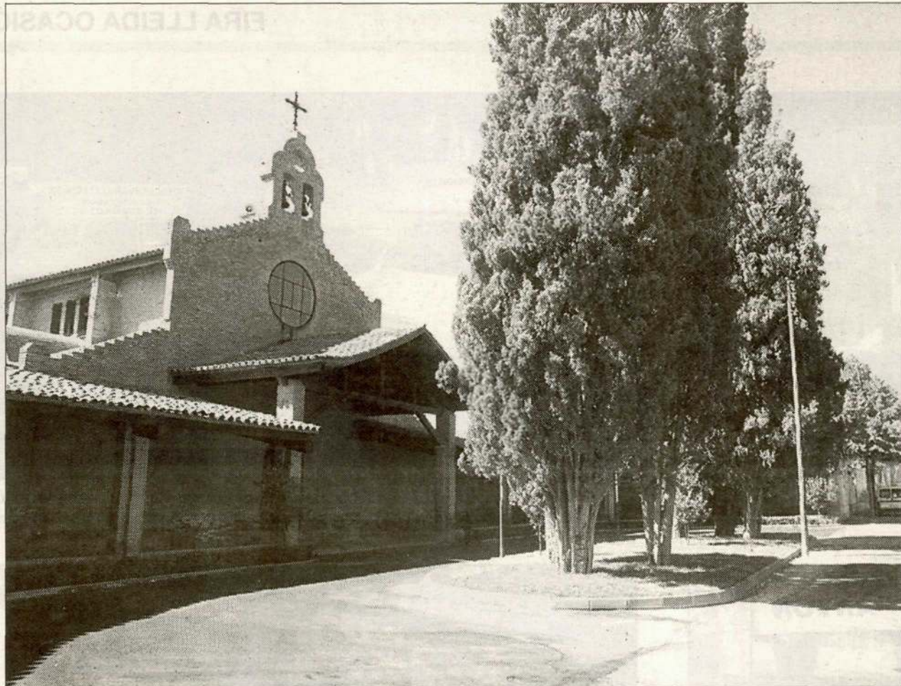
La Paeria treballa actualment en la renovació de la xarxa d'aigua de Raimat.