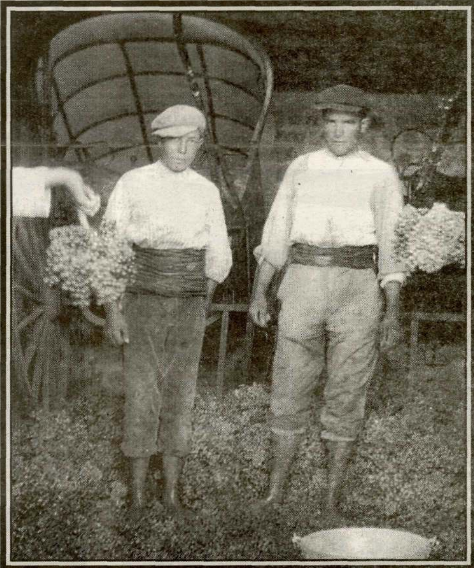
La imatge recull un moment històric: la primera verema de Raimat.