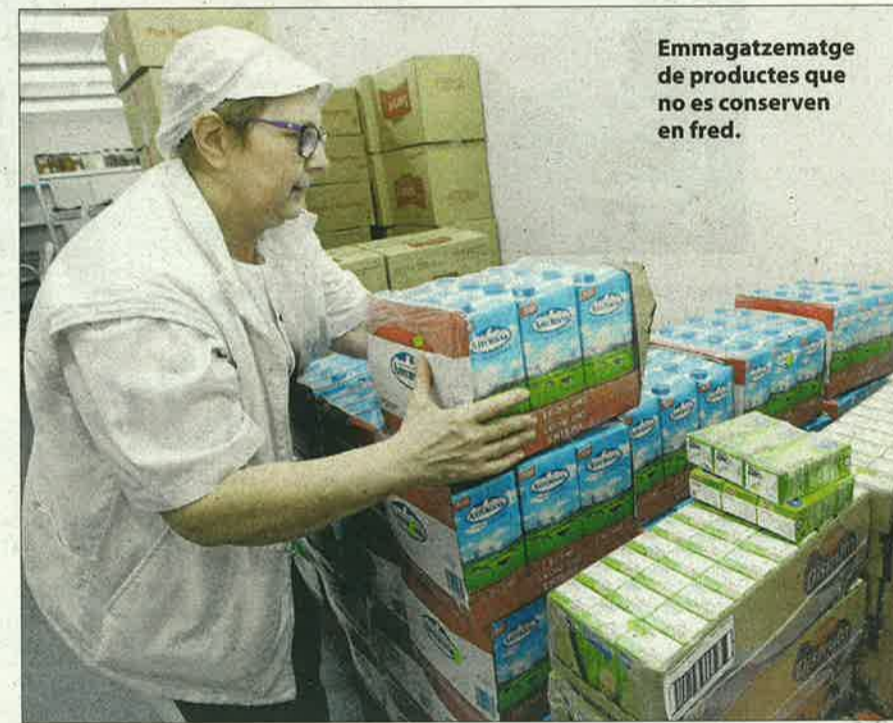
Emmagatzematge de productes que no es conserven en fred.