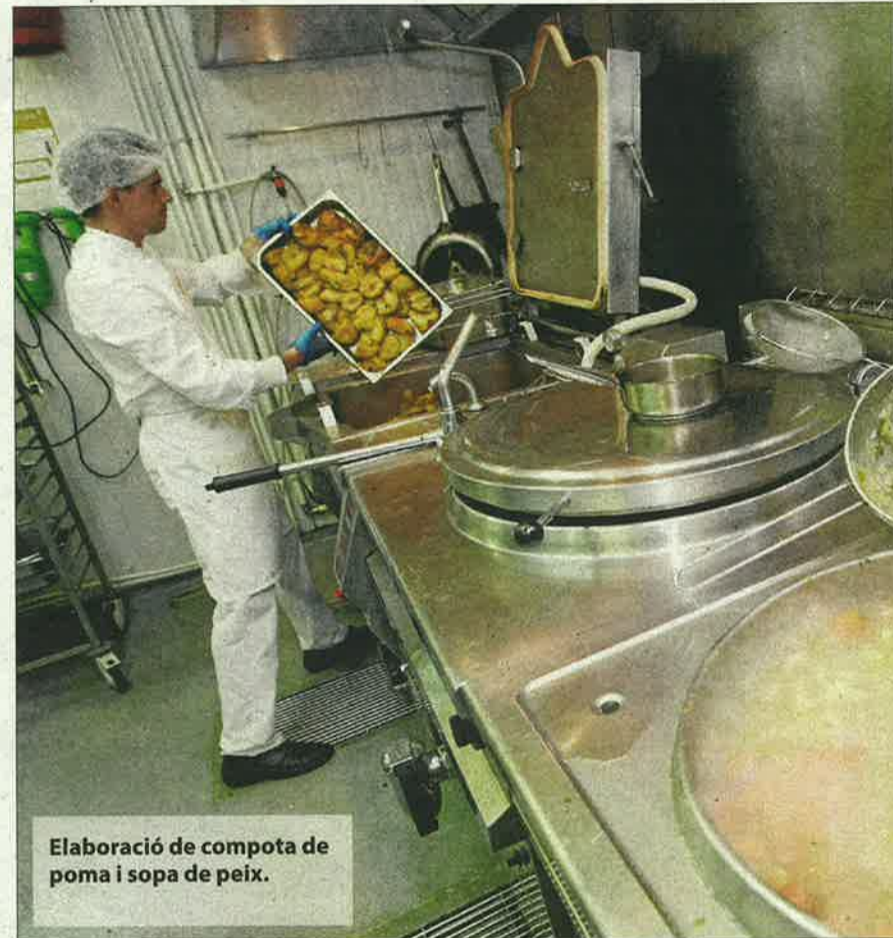
Elaboració de compota de poma i sopa de peix.

La diferència: després de l'emplatat, es refrigera el menjar. "S'escalfa als mateixos carros que serveixen per repartir-la." Es fan vint tipus de dietes diferents tant per qüestions terapèutiques com per motius culturals i religiosos. Un 34% dels menjars són sense sal. La cuina de l'Arnau compra, cada any, més de 40.000 litres de llet i més de 50.000 quilos de productes carnis, a banda de 365.160 unitats de iogurts.