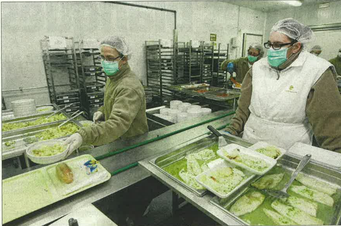
Emplatat d'un dels 150.000 sopars que se serveixen cada any a l'Arnau.

Es preparen vint tipus de dietes diàriament. Un 34% correspon a plats sense sal, un 20% són àpats destinats a pacients diabètics i un 13% són menús de fàcil masticació.