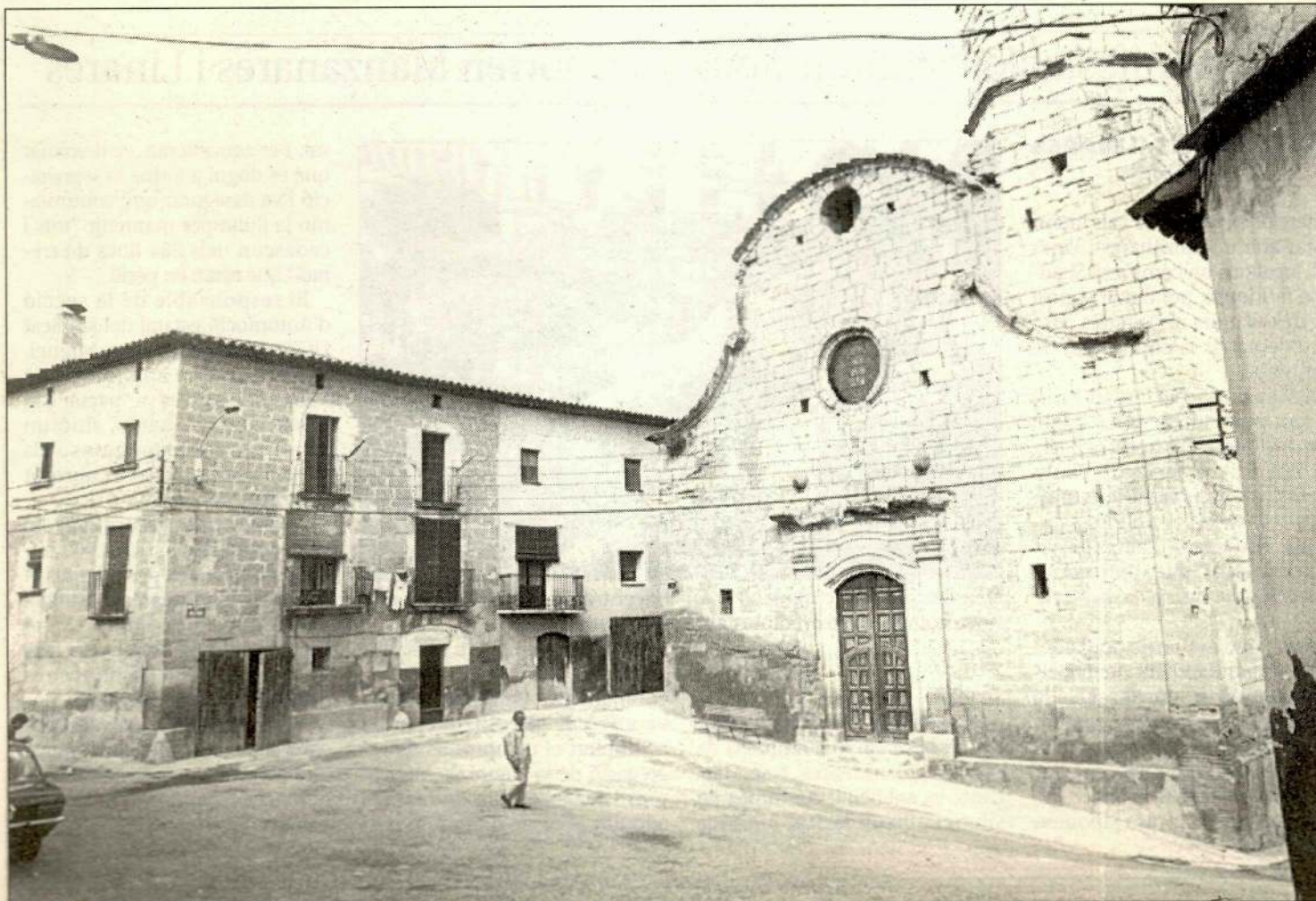
La vila s'omplirà de visitants per gaudir dels millors productes del porc.