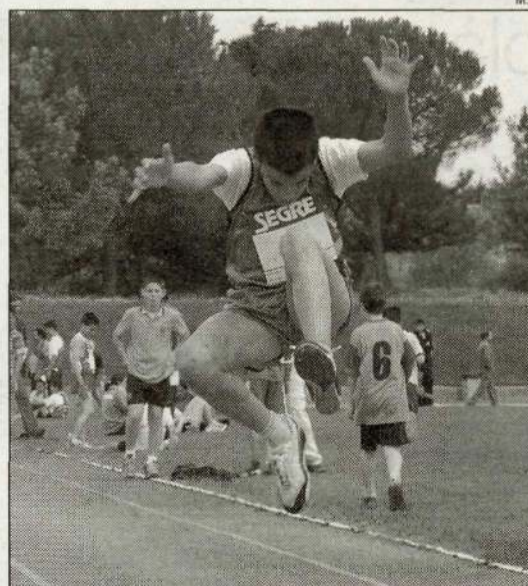
Aprenent els secrets de la llargada.