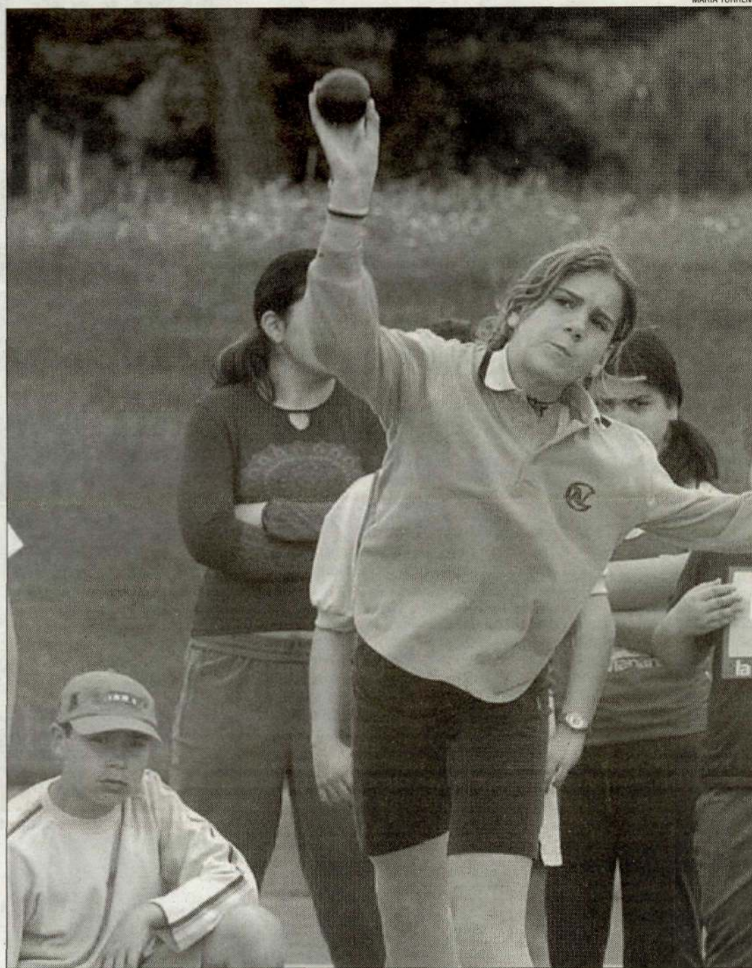
El llançament de pes va ser, com ja és habitual, una de les proves més vistoses.