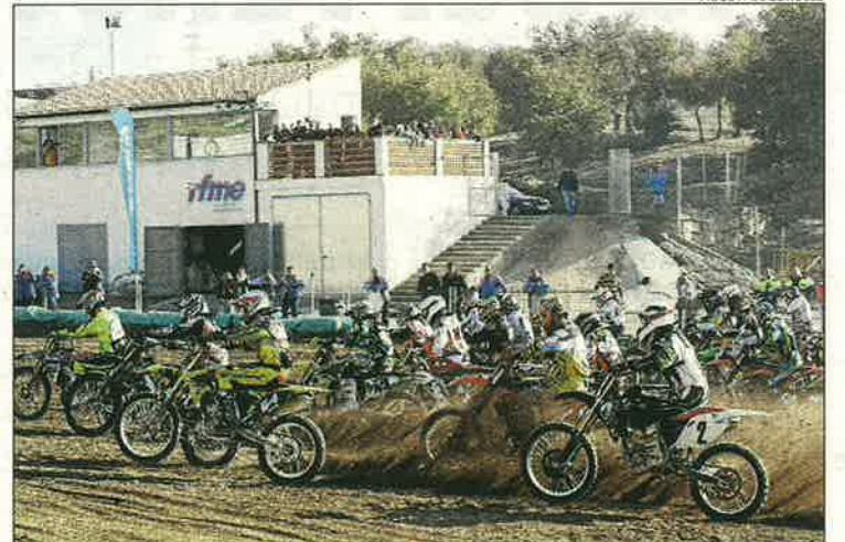
La prova va congrega més de seixanta pilots.