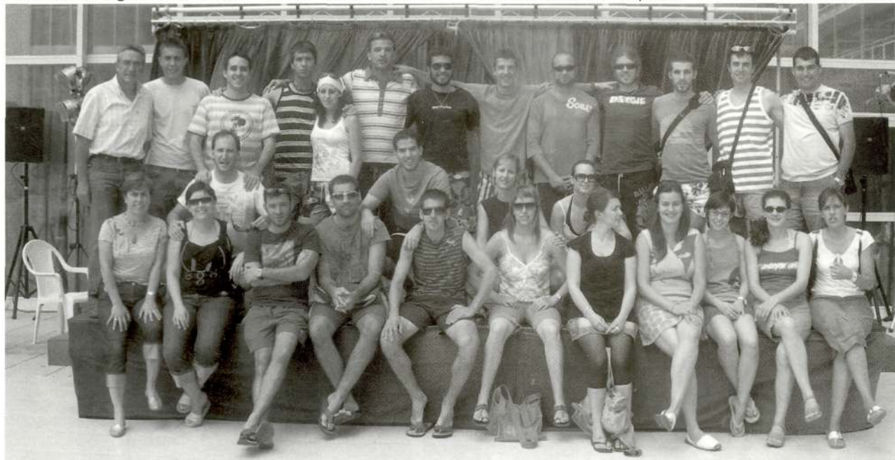
Futbolistes i acompanyants a Platja d'Aro

Corretge SCP, Alpeva SA, Autocars Morell, Autoescola Jové, Automatismes Alfonso Cirera, Bar Can Sastre, Bar El Sol, Bar Las Vegas, Bar Restaurant L'Entrada, Bar Ribera, Botan Immobiliària, Cal Valeri, Carbòniques Calvet, Carnisseria Conxita, Carnisseria Roca, Casañé, Ceagsa Alpicat SL, Centre Òptic Alpicat, Cepsa, Construccions Alpicat SCCL, Construccions