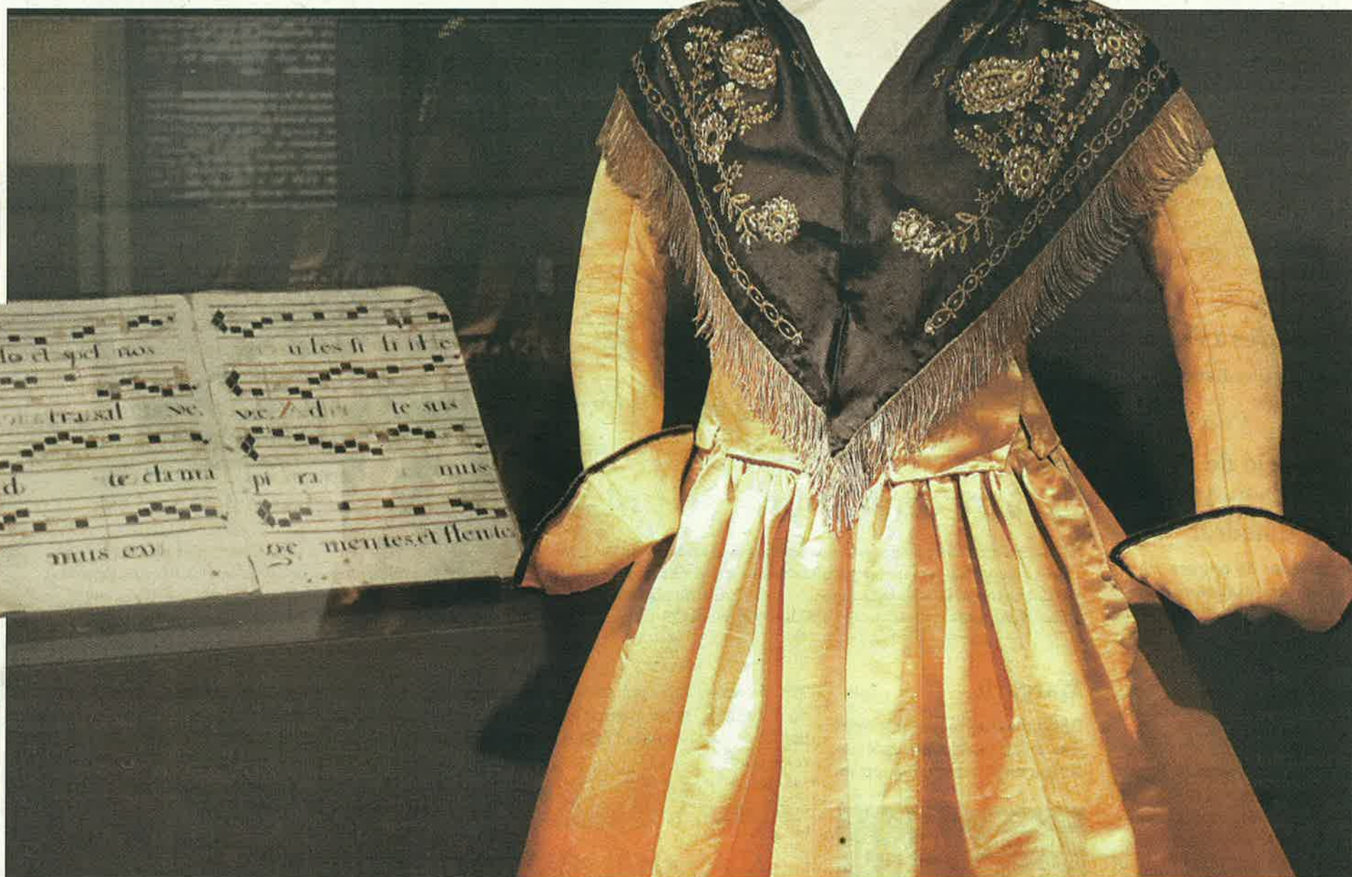
Un vestit d'època i una casulla del segle XVIII procedents del fons de la Casa Carrové de Santa Linya acompanyen l'exposició que es pot veure a Balaguer