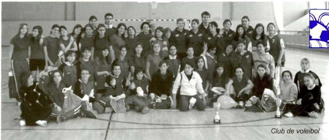
Club de voleibol