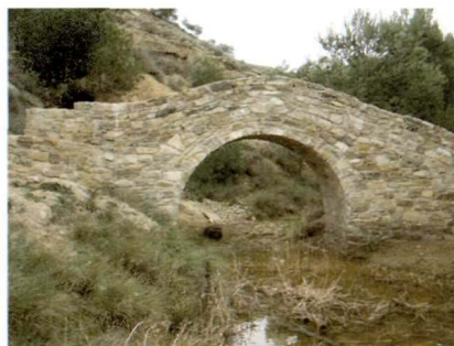
Pont del Tossal de la Corona, construït pels alumnes dels tallers d'ocupació