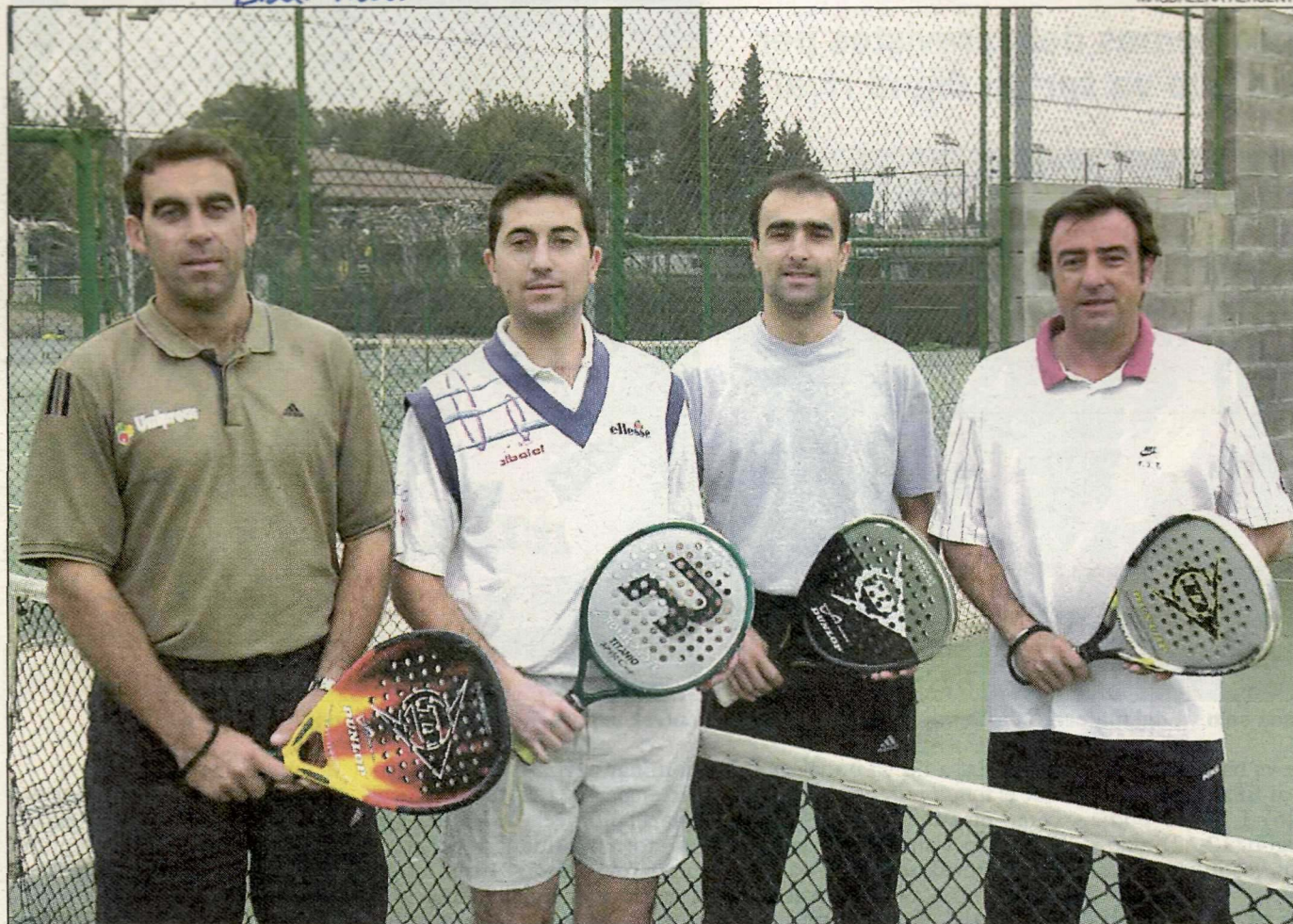
Com que físicament és menys exigent que el tennis, el pàdel va guanyant adeptes entre els lleidatans.