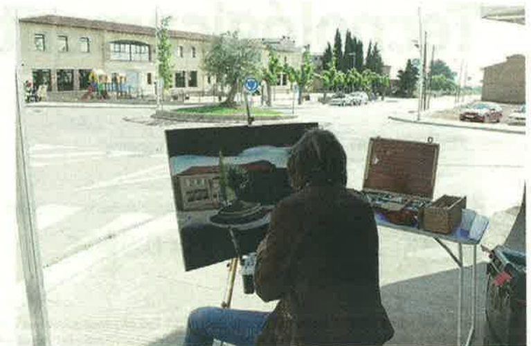
El concurs de pintura ràpida té lloc dissabte