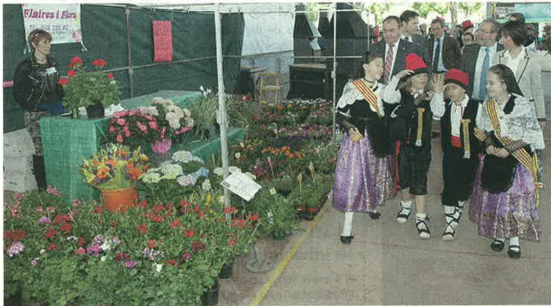
Durant els dos dies de fira hi ha previst diferents tastos, tallers infantils i sortejos