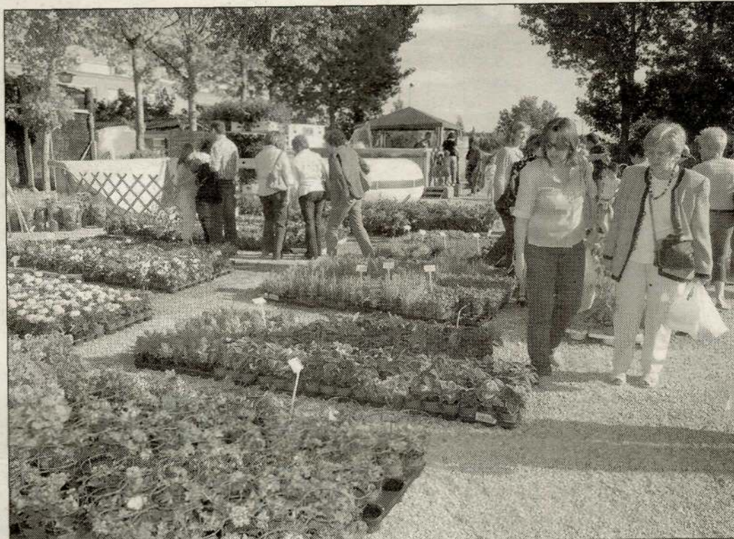
El certamen de jardineria compta amb la participació de firmes italianes i alemanyes.