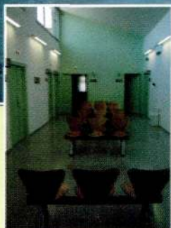
Consultori mèdic d'Alpicat