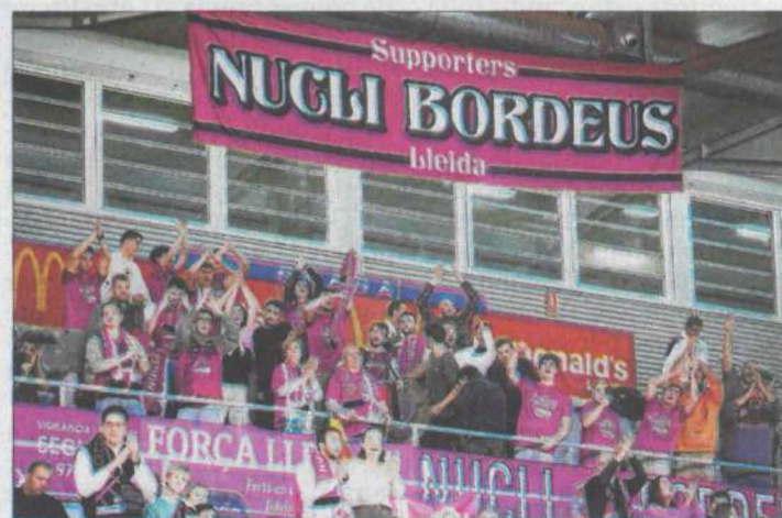
Membres de la penya Nucli Bordeus aquesta passada temporada.

Ser soci de la penya costa aquesta temporada que ve un total de 20 euros, malgrat que això no inclou l'abonament, que cada membre es gestiona individualment. Nucli Bordeus també busca patrocinadors per finançar els desplaçaments, que aquesta temporada volen potenciar.