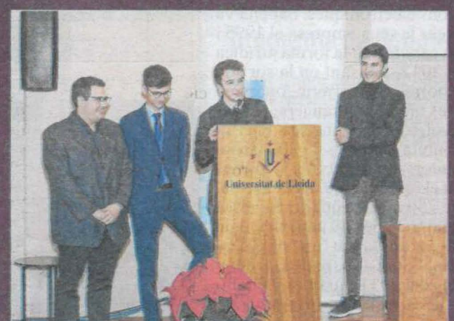
Bones pràctiques de responsabilitat social corporativa

Consell de l'Estudiantat de la UdL - Festes de l'Estudiantat: inclusives, participatives, sostenibles, segures i de proximitat!