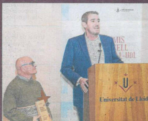
Reconeixement al lideratge social

Federació de Cooperatives Agràries de Catalunya