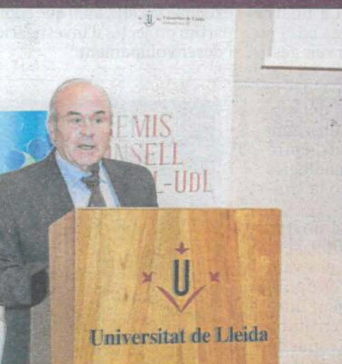
Reconeixement a la institució pel seu compromís amb la UdL

Centre: Facultat d'Infermeria i Fisioteràpia.