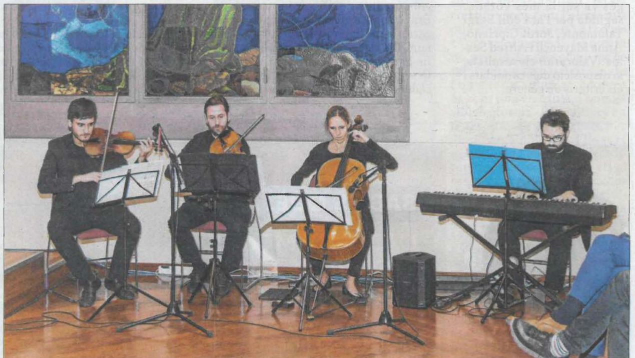
Un detall del concert que va amenitzar l'entrega de premis.

Per finalitzar, el Consell Social reconeix el lideratge social d'alguna institució o entitat vinculada amb el territori. Enguany el guardó s'atorga a la Fundació Aspros, per la seva aportació a la societat lleidatana principalment en la integració de les persones amb capacitats diferents. L'entitat commemora enguany el seu 60è aniversari.