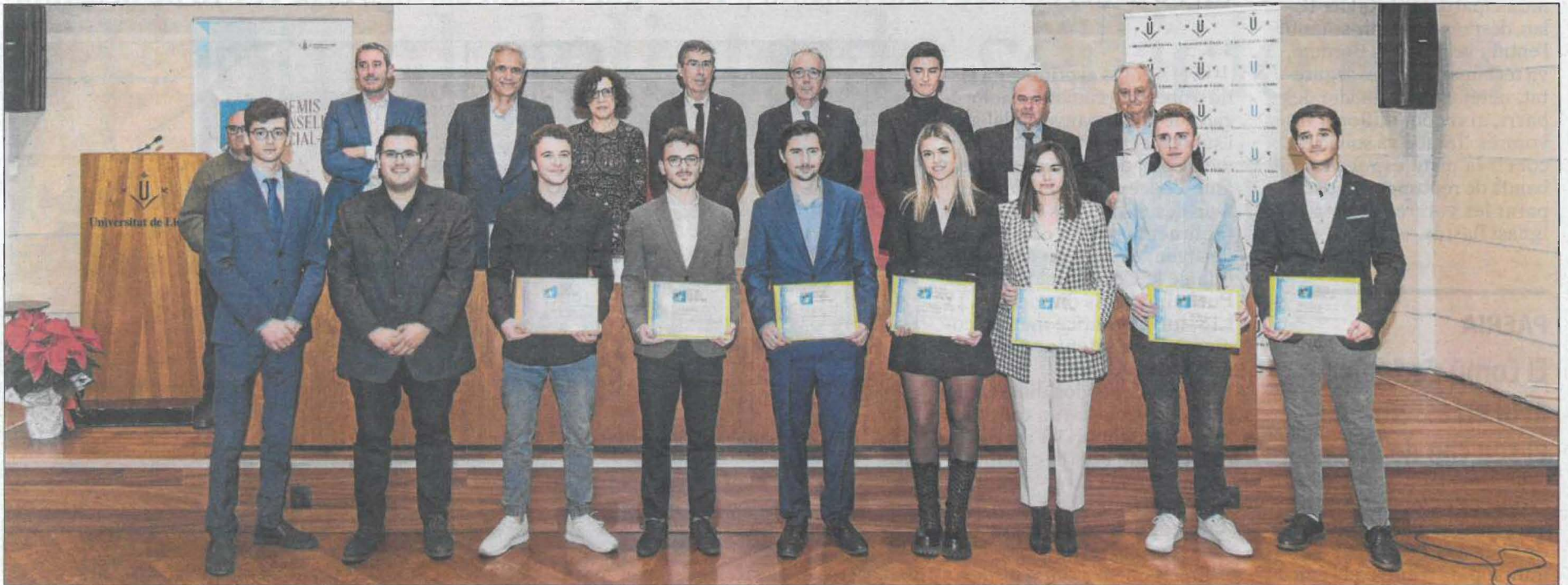
Els premis es van lliurar el passat dia 25.

E ls Premis Consell Social de la Universitat de Lleida arriben a la cinquena edició consolidant-se com un referent a visibilitzar la cooperació de la universitat amb l'empresa i les institucions. D'altra banda, posen en valor l'excel·lència de la comunitat universitària a través del Treballs Finals de Grau en les diferents àrees de coneixement que ofereix la UdL i les bones pràctiques en Responsabilitat Social.