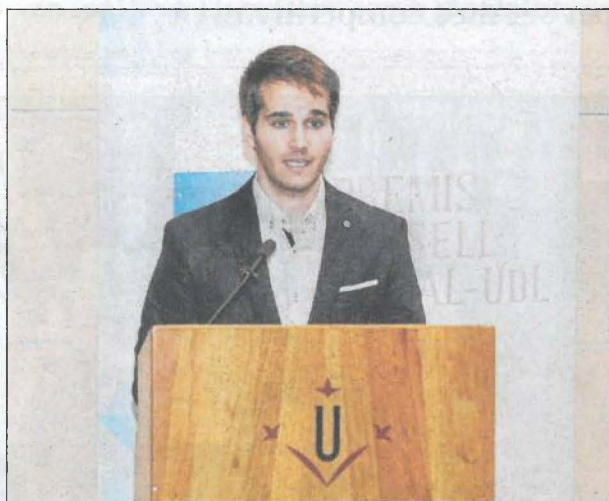
MARC GALOFRÉ CASES

MILLORS TREBALLS FINAL DE GRAU D'ESTUDIANTS QUE CONTINUEN EL MÀSTER A LA UdL