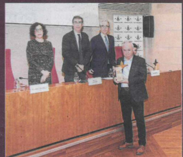
Cat. mitjana i petita empresa Industrial Leridana del Frío, S.L.