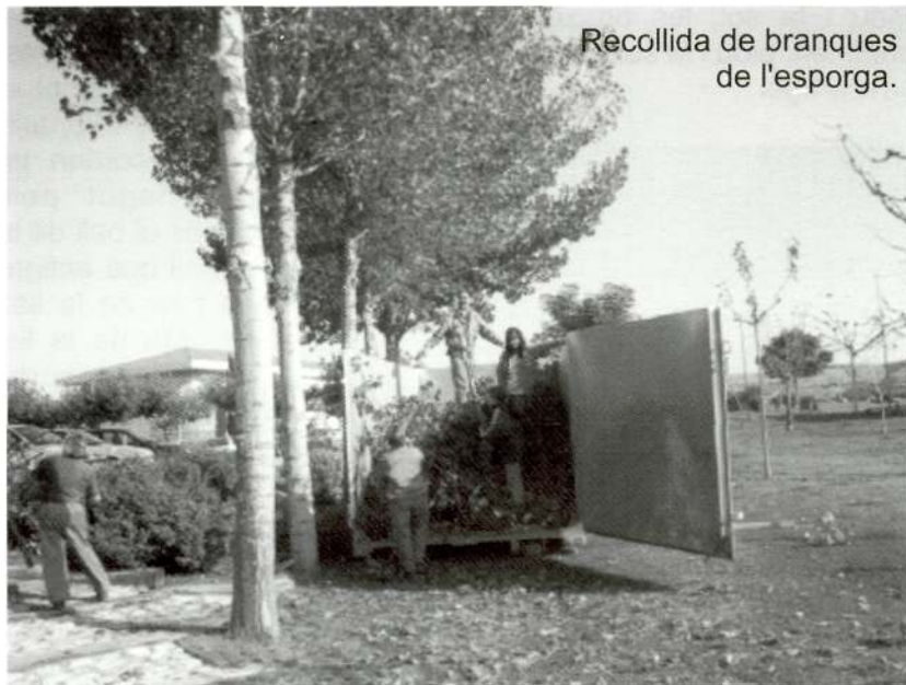
Recollida de branques de l'esporga.

Manteniment i recuperació del parc del Molí: desbrossament de la gespa, replantar, netejar... Manteniment i restauració del parc del Graó: preparació del sòl i sembra de la gespa, esporga dels arbres, netejar i pintar els locals... Manteniment i restauració de les piscines municipals: segar la gespa, esporgar, desbrossar... Manteniment i restauració del parc de la Bassa: esporga dels arbres i neteja d'arbustos. Manteniment i restauració de la