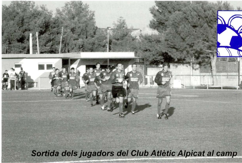
Sortida dels jugadors del Club Atlètic Alpicat al camp

Des d'aquestes línies el club dóna les gràcies a l'Ajuntament d'Alpicat, als socis i aficionats, i a totes les empreses, locals i forànies,