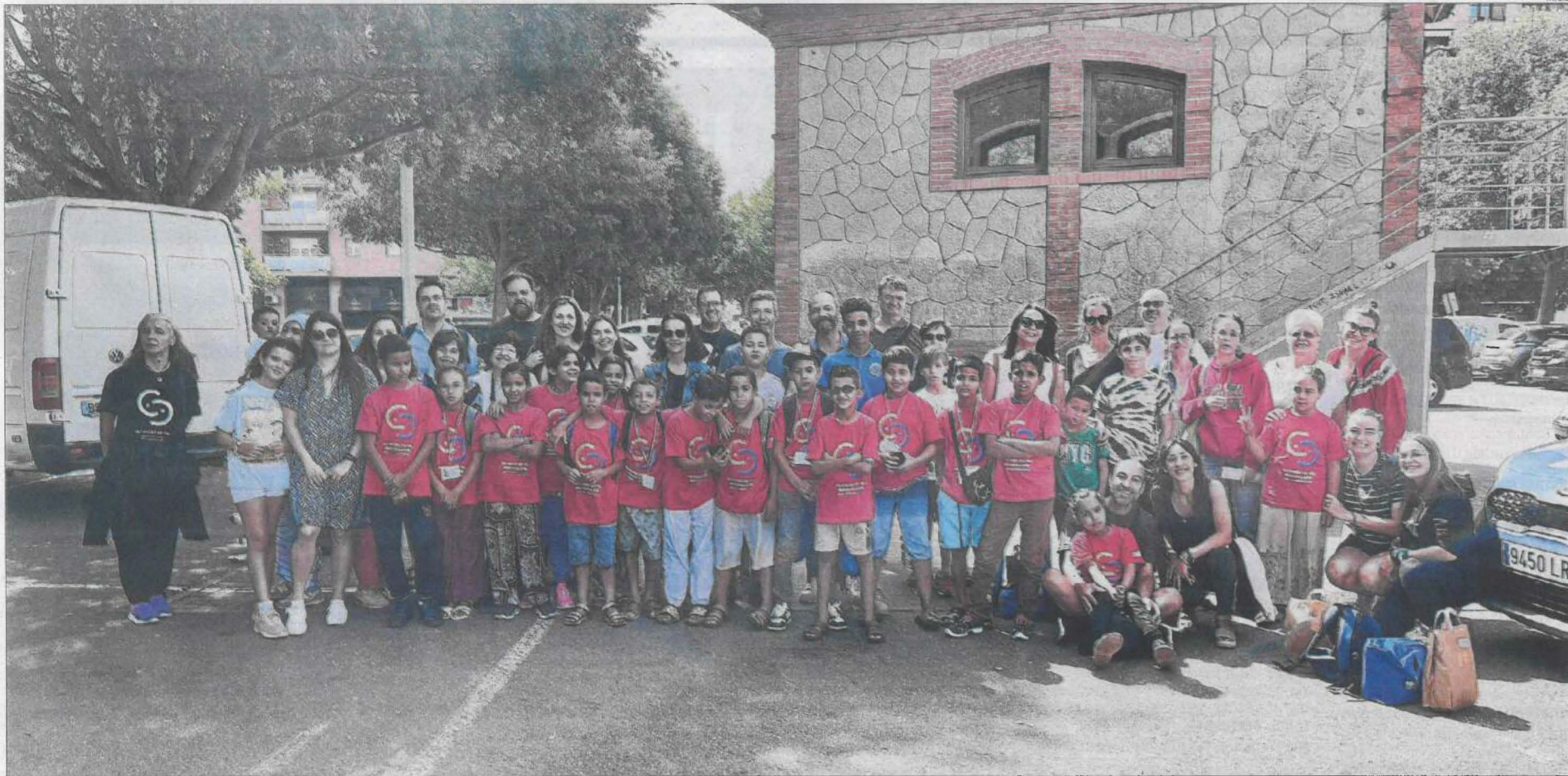
Els petits sahrauís i les seues famílies d'acollida del Segrià, ahir després del retrobament a l'aparcament de Barris Nord a Lleida, hores després d'aterrar al Prat.