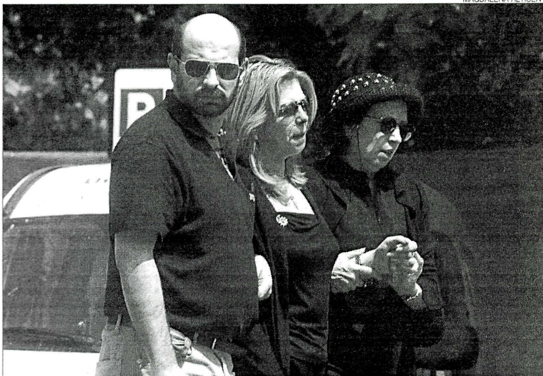
Les escenes de dolor es van succeir durant tota la jornada.

Paral·lelament, la calcinació dels teixits dificultava l'esbrinament de la identitat a través de l'estudi de les empremtes dactil·lars. Per aquest motiu, els facultatius van haver de recórrer a altres mètodes, com l'estudi de les dentadures i els ossos de les víctimes del sinistre. ●