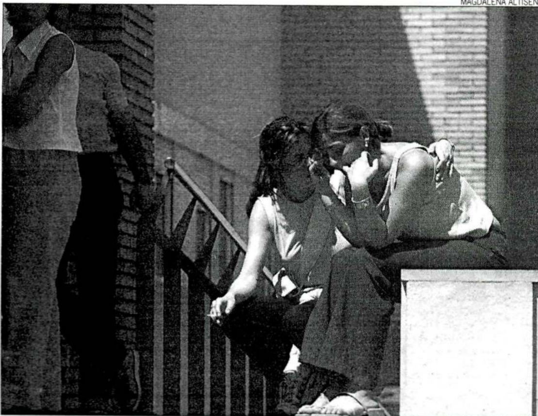
Familiars i amics de les víctimes esperen els resultats de les autòpsies entre plors.

Va ser un fort cop. Un equip de psicòlegs i psiquiatres del Santa Maria atén des de divendres les famílies de les víctimes. Assimilar la tragèdia és dur, però només és el principi del malson. Per als familiars i amics més pròxims, les hores han passat molt lentes. Primer es va haver d’esperar l’aixecament dels