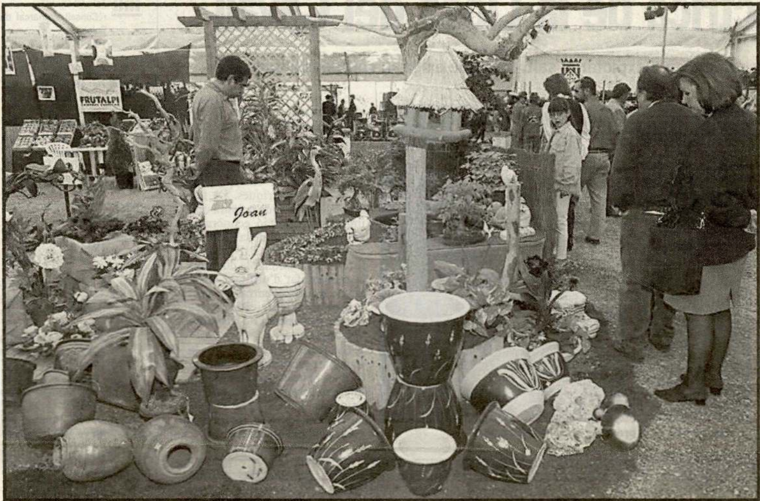
Cada any la fira supera les previsions de visitants i el número d'empreses exposidores.

La majoria de la gent no pot gaudir de grans terrenys per plantar un jardí, per això, Jardins Joan ha organitzat aquest taller, que ensenyarà alguns trucs per fer jardins en petits espais.