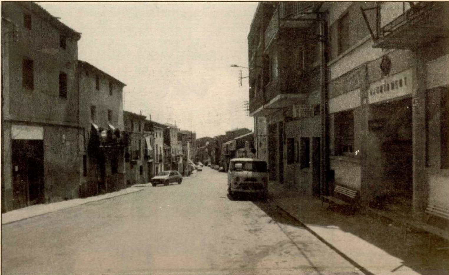
Els vilatans i els visitants podran gaudir d'uns dies de joia a Alpicat.

A les 11 de la nit, gran ball de diables i corre-focs pels carrers del poble amb la colla 'Diables de Lleida'. A continuació, gran batalla d'aigua a la plaça Catalunya, organitzada per les penyes de la vila.