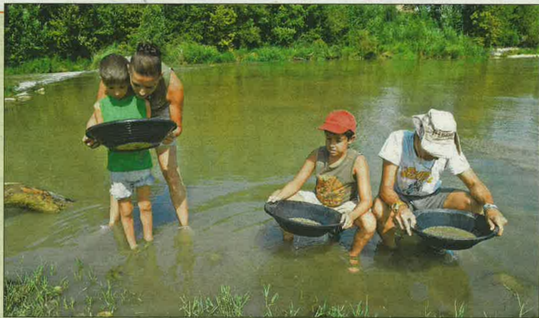
El Museu de l'Or recorda el passat àuric del riu Segre amb tallers per buscar or

"Ni per tot l'or de Balaguer", diuen algunes cançons de gesta fent referència al riu Segre. Sense anar més lluny, el predicador i professor de l'Estudi General Anselm Turmeda també afirma que hi ha vist or "en abundància barrejat amb arena". I és que fet i fet el Segre sempre havia estat un riu àuric. Avui, el Museu de l'Or, ubicat a l'antic edifici del Molí de l'Esquerrà i situat estratègicament a la vora del Segre, reivindica aquest passat amb activitats que permeten buscar or tant al riu com a les pròpies instal·lacions. I és que s'explica que el Segre, que naix a la Cerdanya francesa i beu del Valira i les dos Nogueres, sempre havia estat ric en aquest metall. Si és a