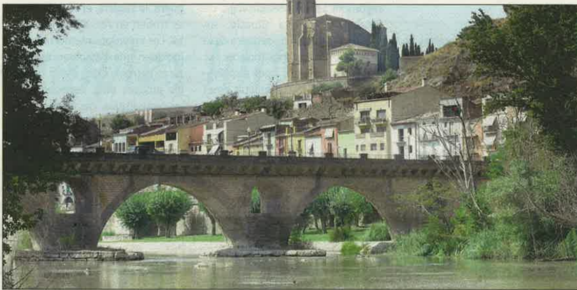
El riu, Santa Maria i el pont dibuixen la imatge que esdevé l'autèntic 'sky line' de la ciutat

Però si d'una cosa presumeix Balaguer, a més de la plaça, és de la seva façana fluvial. El riu Segre és el nexa d'unió entre el centre històric i el Balaguer nou que, pas-