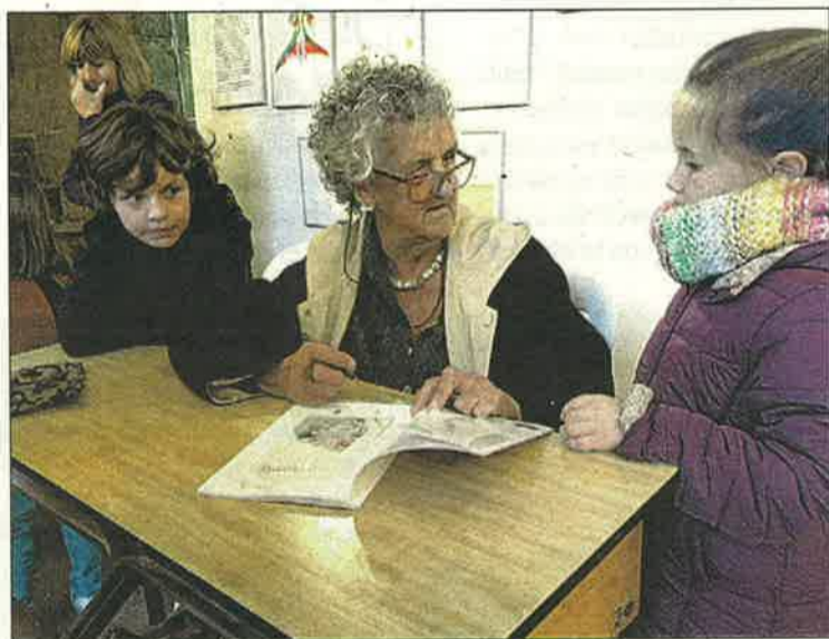
Roser Capdevila amb el seu públic preferit