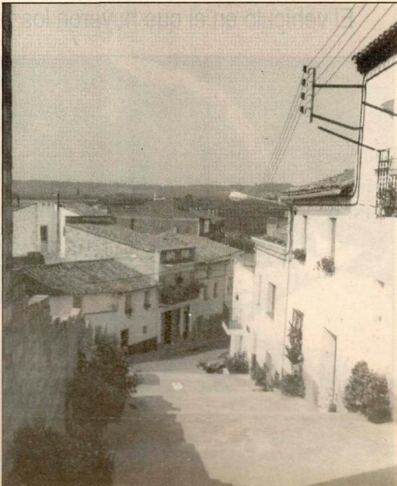
El batlle de la vila i un dels carrers de la localitat.