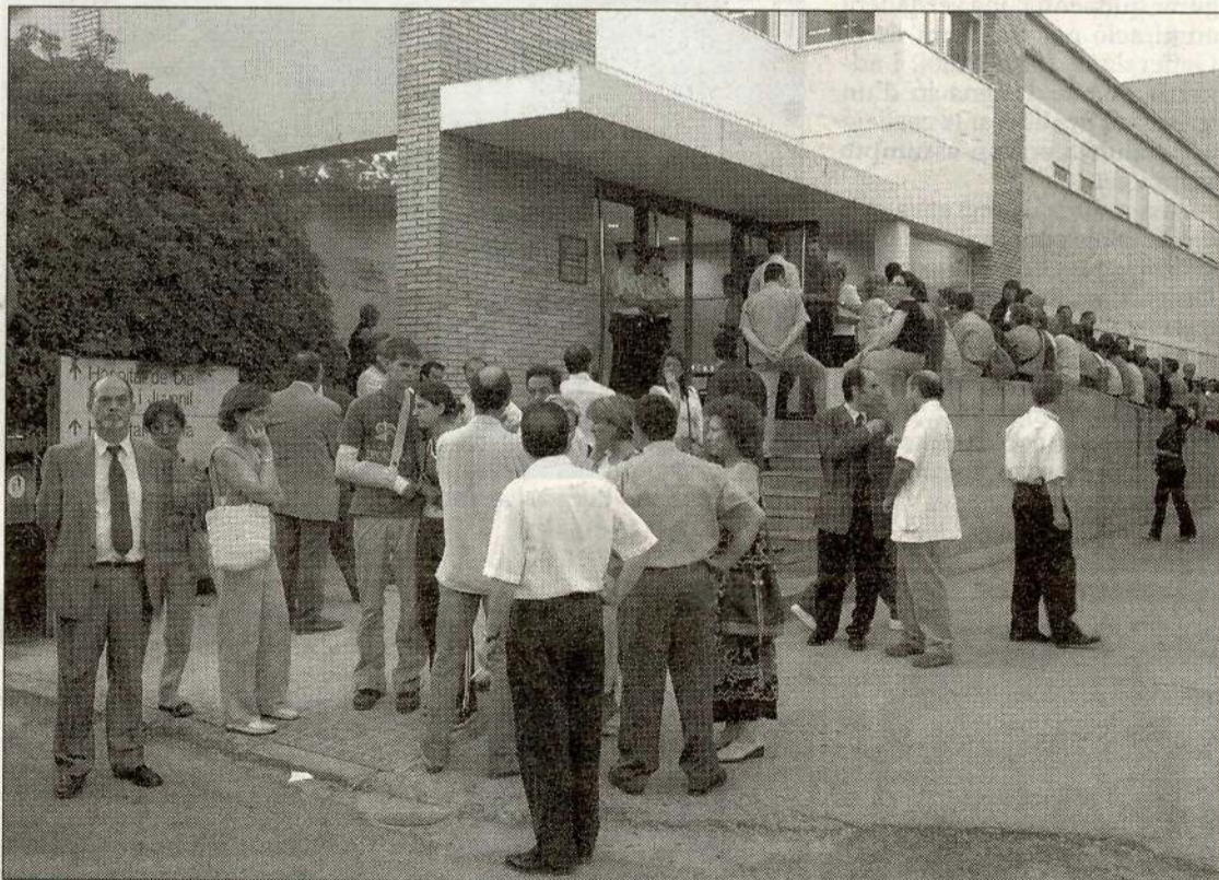
Familiars de les víctimes es van concentrar davant de l'hospital on van ser portats els cossos.

Els màxims dirigents del Govern van acompanyar els familiars de les víctimes que arribaven a l'Hospital Santa Maria, on es troben les restes dels vuit ca-