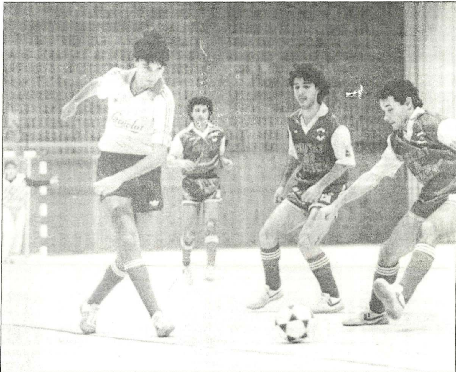
Els partits de futbol, un dels centres de la programació.