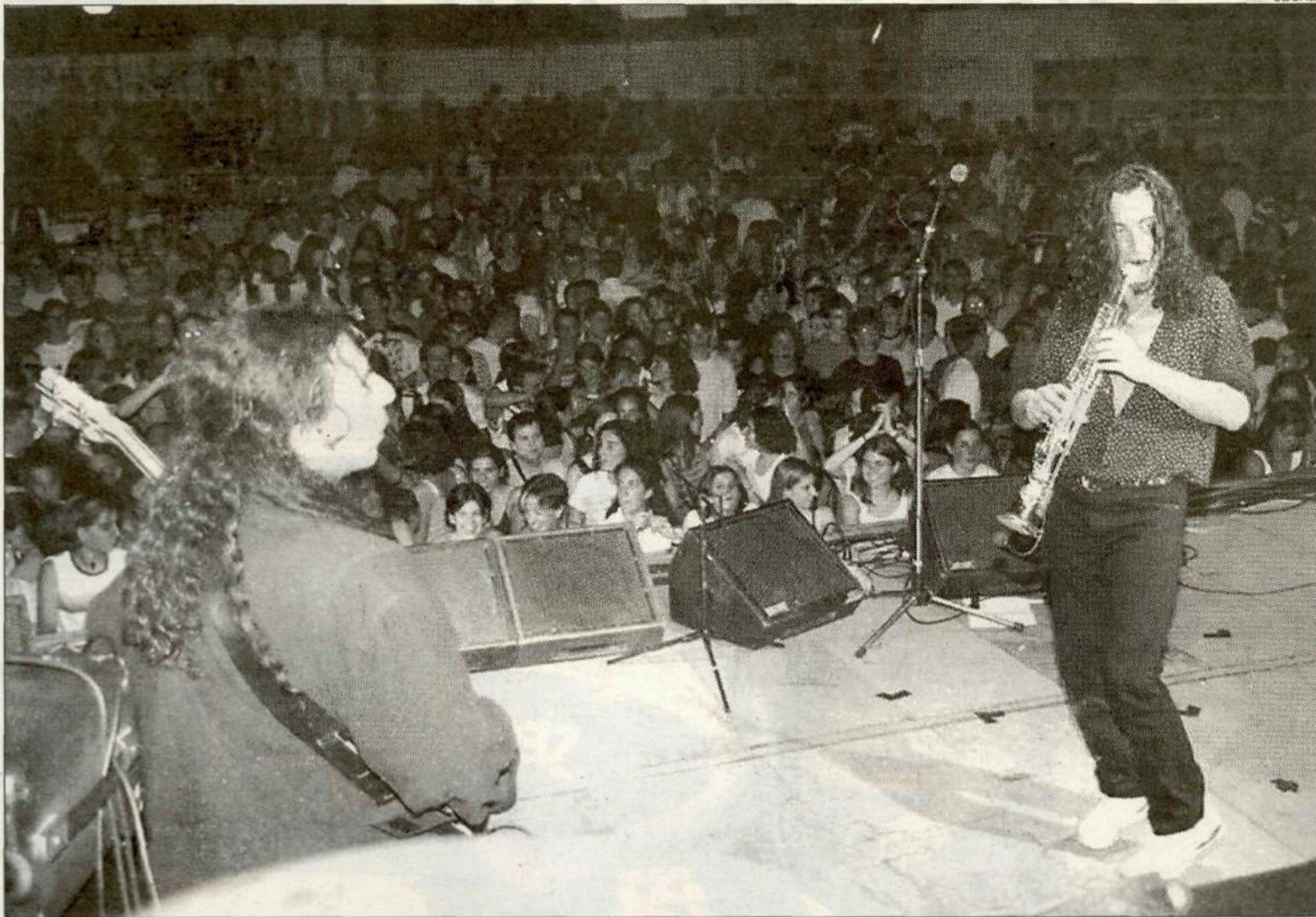
L'Electrica Dharma és un dels grups que actuarà al Meloman Alpicat Festival, una iniciativa que es posa en marxa enguany.