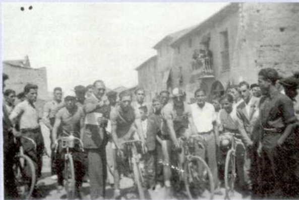
Cursa de bicicletes