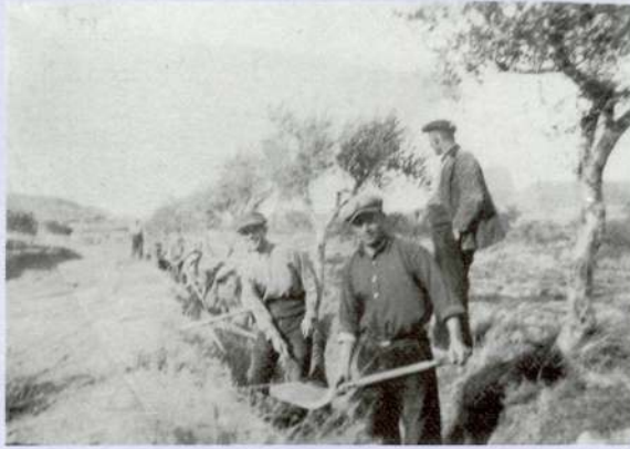
Netejant les sèquies (amb pics i pales)