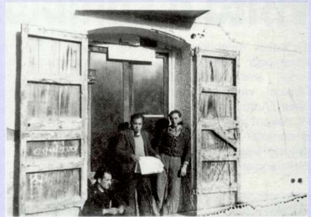
Barberia cal Fraga