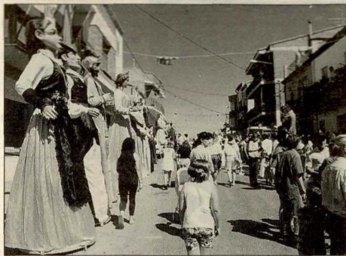
Els gegants, protagonistes el matí de diumenge