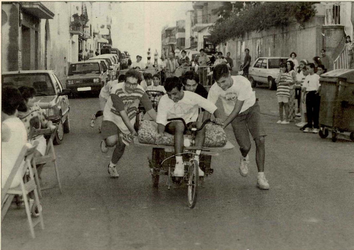
La cursa de llits congrega una gran nombre de participants