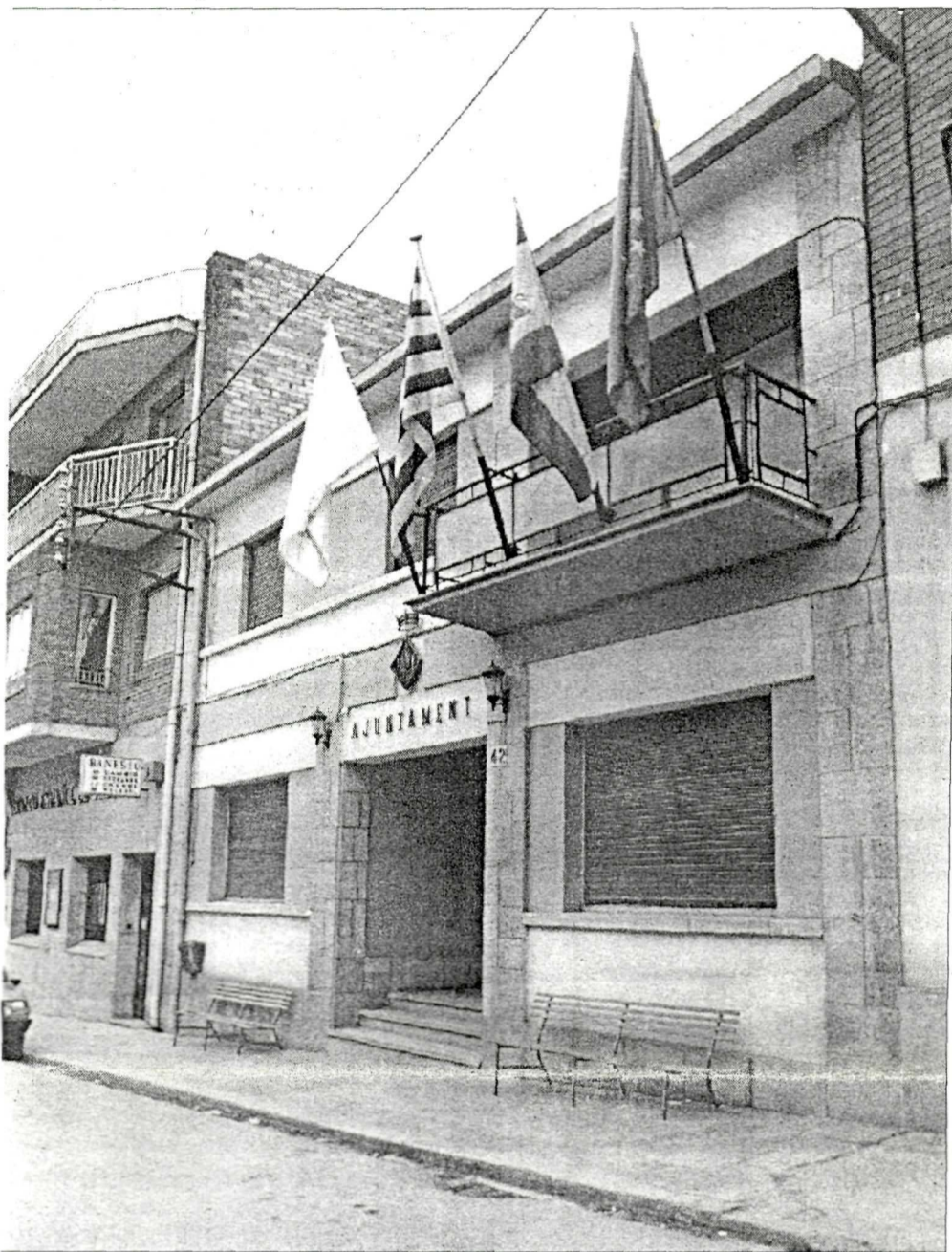
L'ajuntament d'Alpícat proposa una festa participativa i plena d'activitats.