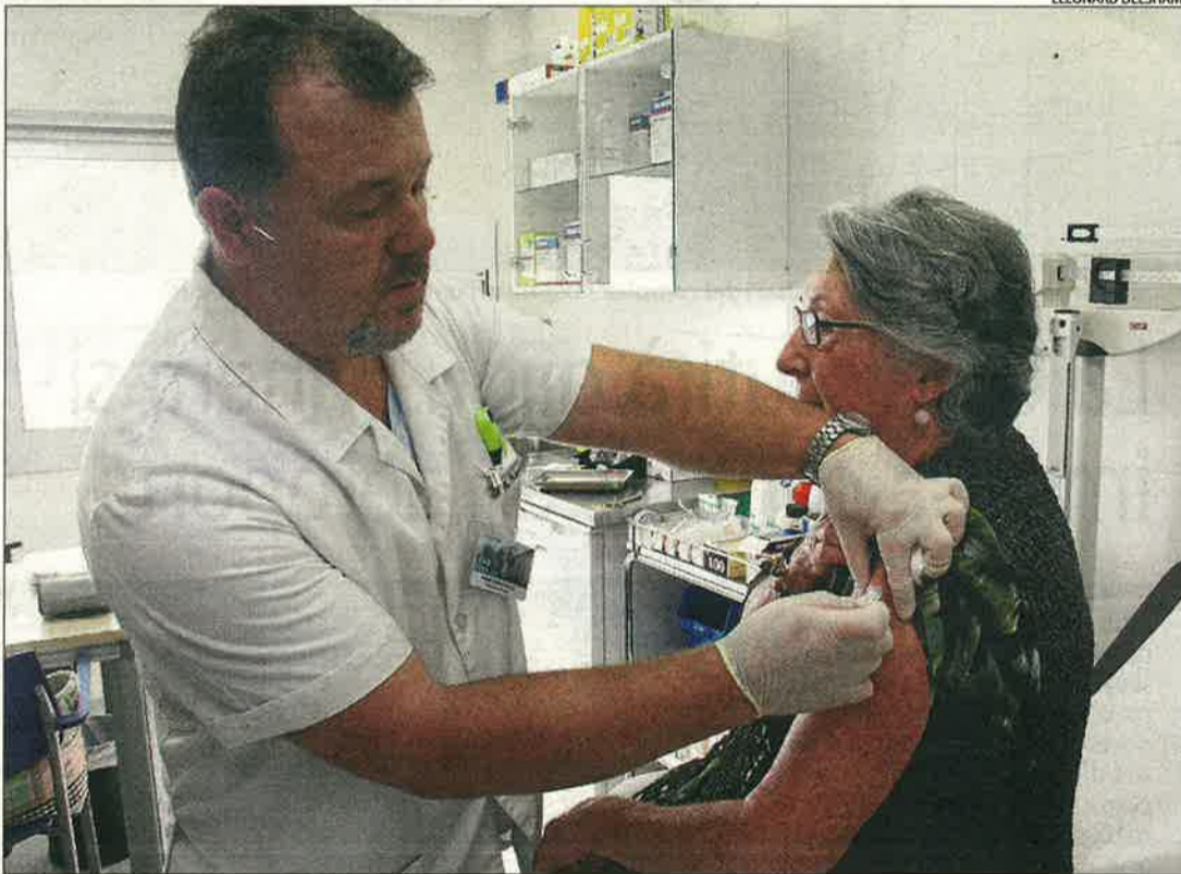
Un infermer del centre mèdic de salut d'Alpicat administrava ahir la vacuna de la grip a una dona.

A partir del 13 d'octubre Concerteu cita al vostre Consultori mèdic