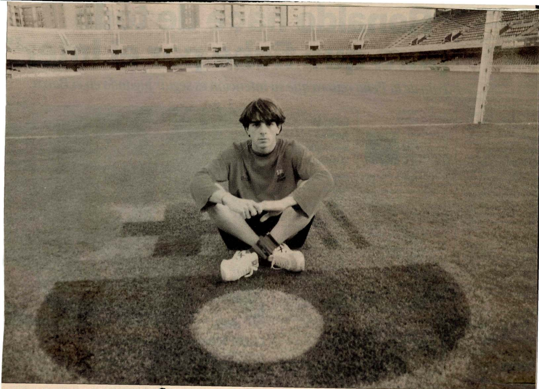
Marcó los dos goles de su equipo ante el Lleida y aunque sigue rememorando ese momento histórico, ayer volvía a entrenar con el tercer equipo barcelonista sin ningún problema