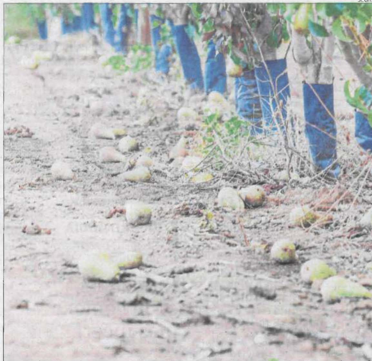
La meteorologia ha tornat a jugar en contra del sector.

Les altes temperatures reduiran la producció de fruita