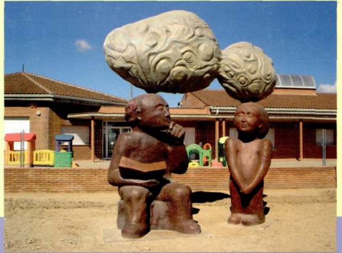
17.2.05 Col·locació de l'escultura El mestre i l'alumne