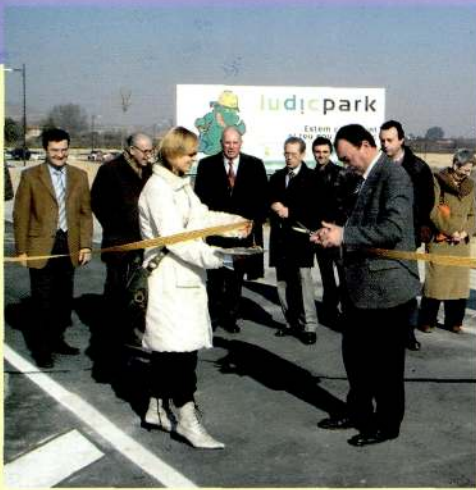
4.2.05 Inauguració de les obres del camí Vell d'Alpicat