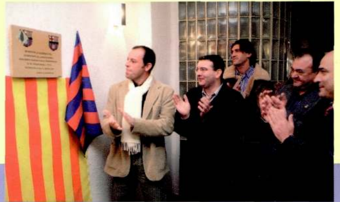
12.12.04 5è. aniversari de la Penya Blaugrana d'Alpicat. Visita del Sr. Sandro Rosell, vicepresident del F.C. Barcelona