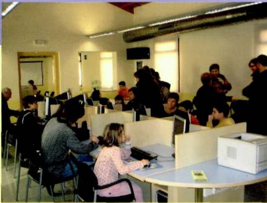
27.2.05 Portes obertes al Centre Telemàtic d'Alpicat