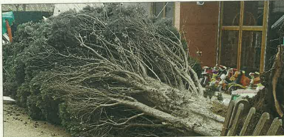
AJUNTAMENT DE LINYOLA

Glòria va provocar ahir fortes ràfegues de vent que van causar dos ferits a Balaguer i Alpocat. A la Noguera, un mur va caure sobre una dona i al Segrià un tub va impactar contra un home.