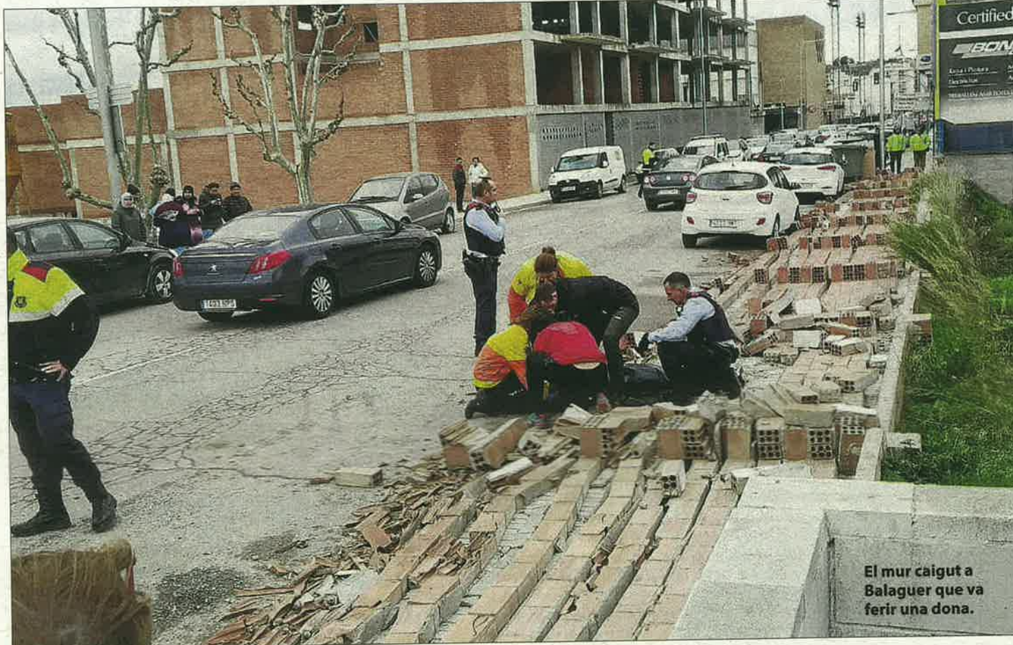
PAERIA DE BALAGUER