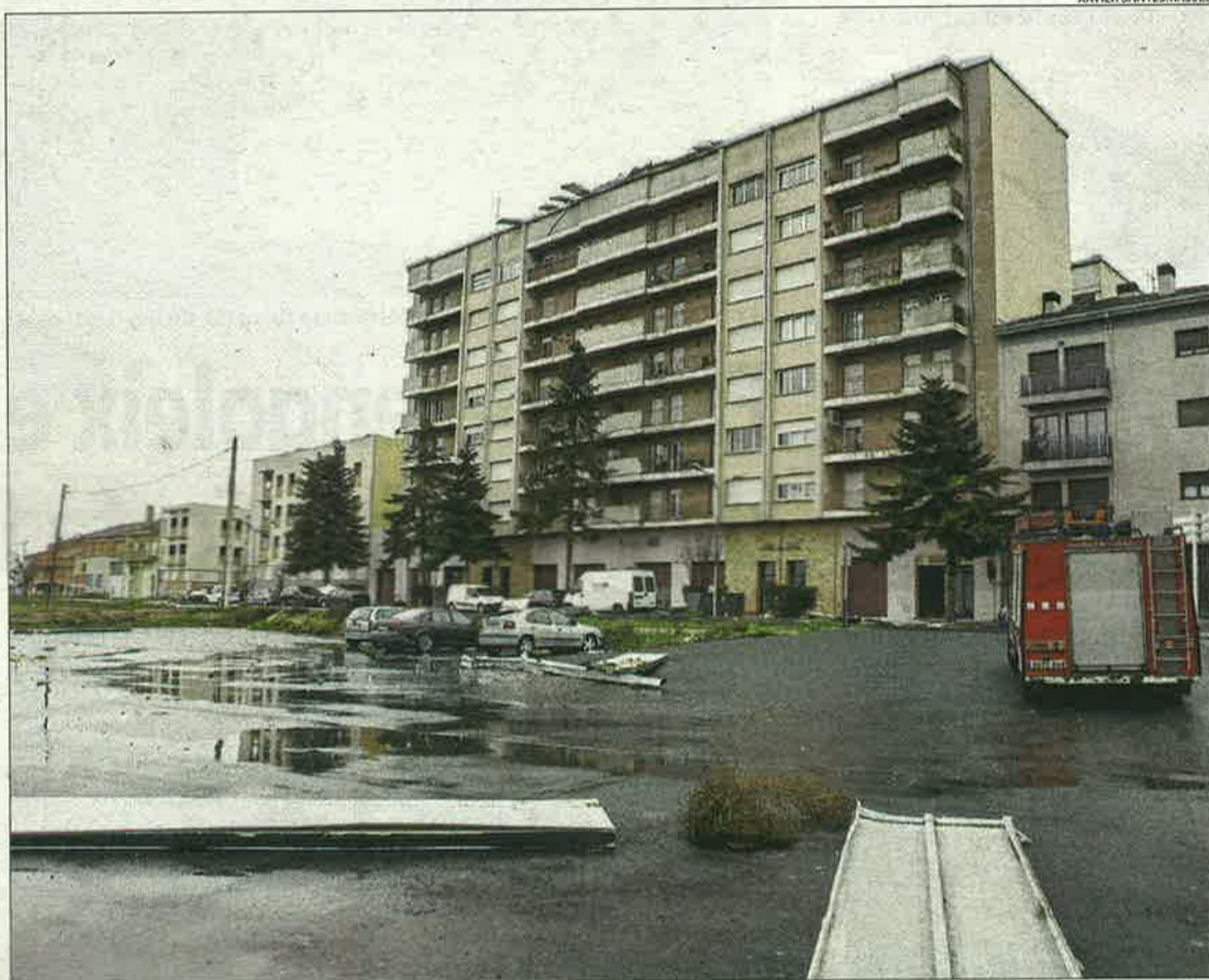
El vent va arrancar la teulada dels blocs Flors de Maig, a Cervera, i la caiguda va provocar danys als cotxes.

Les fortes ratxes de vent van tombar arbres i pals de llum, van provocar talls de subministrament elèctric que van afectar uns 5.300 abonats i van fer caure murs. Els Bombers van rebre uns 120 avisos. A Cervera, professors i alumnes del col·legi Jaume Balmes van quedar confinats per desprendiments a la teulada i van sortir per una porta lateral després que els Bombers asseguressin la coberta. També a Cervera, el vent va arrancar la teulada dels blocs d'habitatges Flors de Maig, fet que va obligar la Policia Local a tancar l'accés a la ciutat per la carretera de Guissona. També va caure part de la teulada de