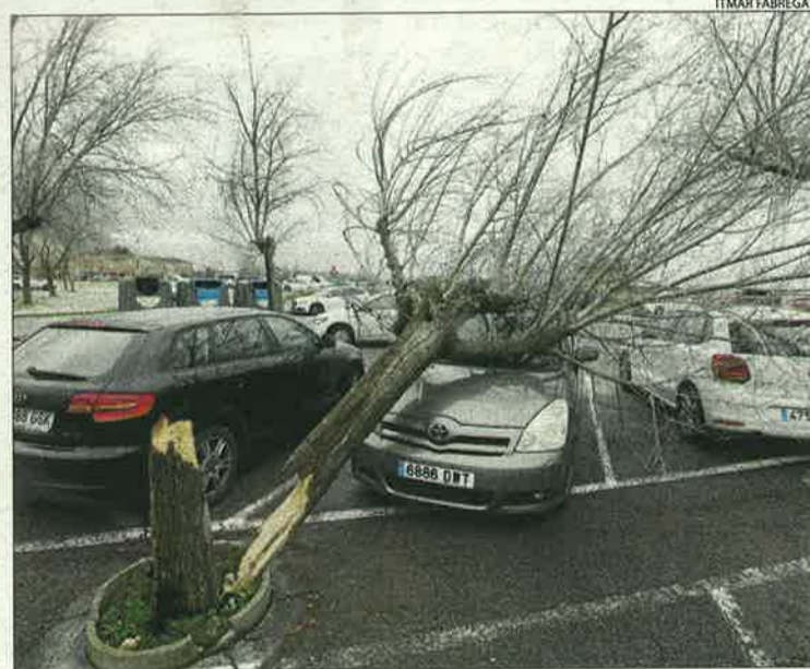
Un arbre va caure ahir sobre un cotxe al pàrquing d'INEFC a Lleida.